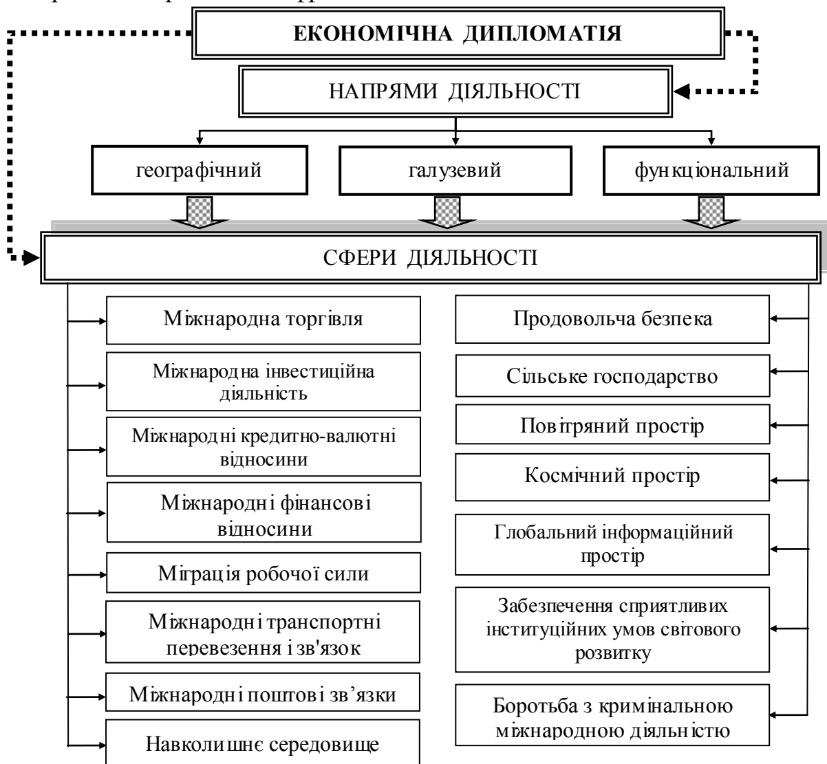
Рис. 3. Напрями і сфери функціонування механізму економічної дипломатії (розроблено автором)

У третьому розділі «Диверсифікація функціональної структури механізму економічної дипломатії України» досліджено і визначено, що інтереси економічної дипломатії формуються в залежності від досягнутих результатів експортно-імпоротної діяльності України як у взаємодії з країнами-партнерами чи інтеграційними угрупованнями, так і з орієнтацією виходу на нові стратегічні цілі щодо завоювання нових ніш і освоєння нових сегментів на міжнародних ринках (рис. 3). Пріоритетним напрямом для економічної дипломатії тут є вектор ЄС Серед інших векторів економічної дипломатії в географічному напрямі слід звернути увагу на співробітництво з країнами Азії і, в першу чергу, з Китаєм, Індією, Туреччиною, Іраном. Перспективними, але на даний час недостатньо ефективними, є напрями співпраці з Америкою та Африкою.