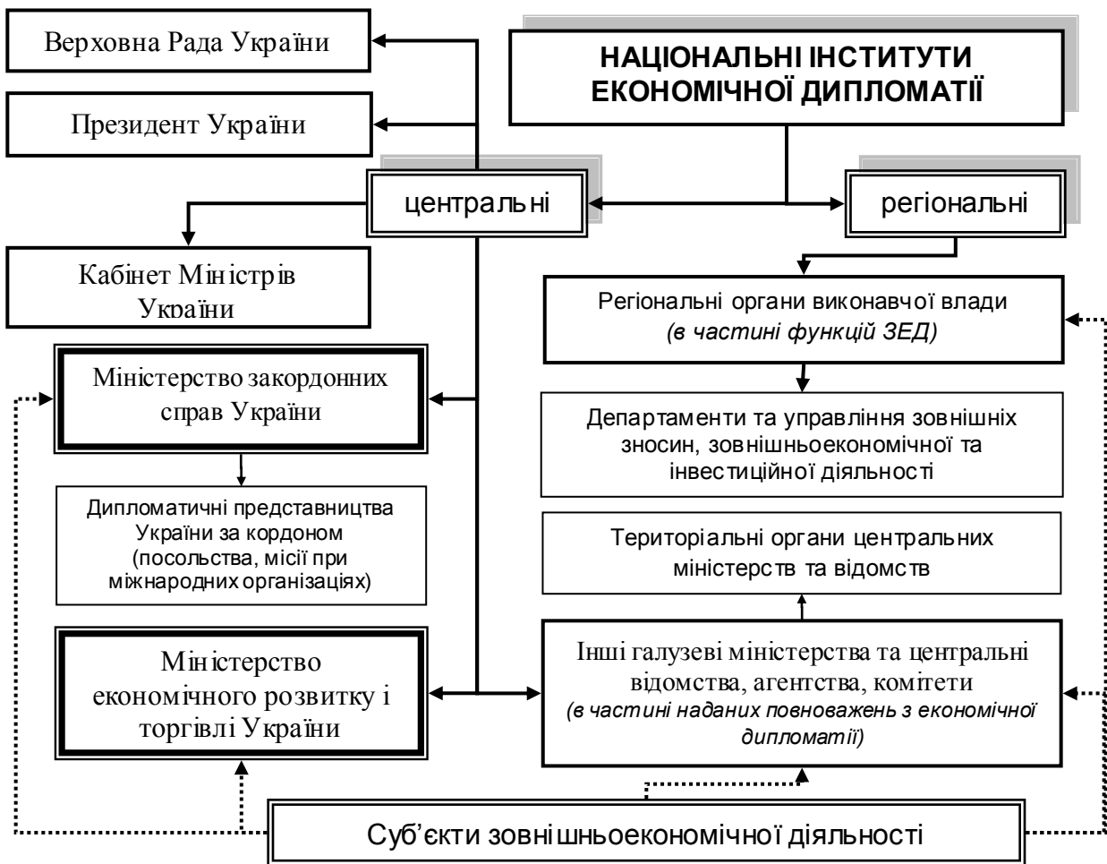
Рис. 2. Механізм взаємодії національних інститутів економічної дипломатії України (розроблено автором)

Доведено, що важливим аспектом в механізмі економічної дипломатії є роль держави, оскільки суб'єкти господарювання мають можливість виступати реальним актором економічної дипломатії лише на її макрорівні, так як її мезо- і, тим більше, макрорівень знаходяться в полі можливого впливу суто держави, а якісне наповнення економічної дипломатії може набувати істотних відмінностей залежно від країни (рис. 2). При цьому реалізація економічної дипломатії України повинна забезпечуватись, з одного боку, інститутами законодавчої влади, центральними та регіональними органами виконавчої влади, з іншого – безпосередньо суб'єктами ЗЕД, які є експортерами та імпортерами продукції і послуг, партнерами в інвестиційному співробітництві та кооперації.