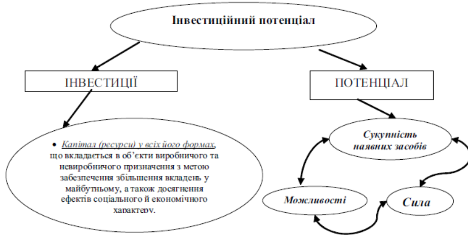
Рис. 1.1. Концептуалізація терміну "інвестиційний потенціал" [26]

одною для досягнення поставлених цілей. Категорія "інвестиційний потенціал" відображає ступінь можливості вкладення коштів у активи довгострокового використання, включаючи вкладення в цінні папери (фінансові інвестиції) з метою отримання прибутку або економічних результатів.