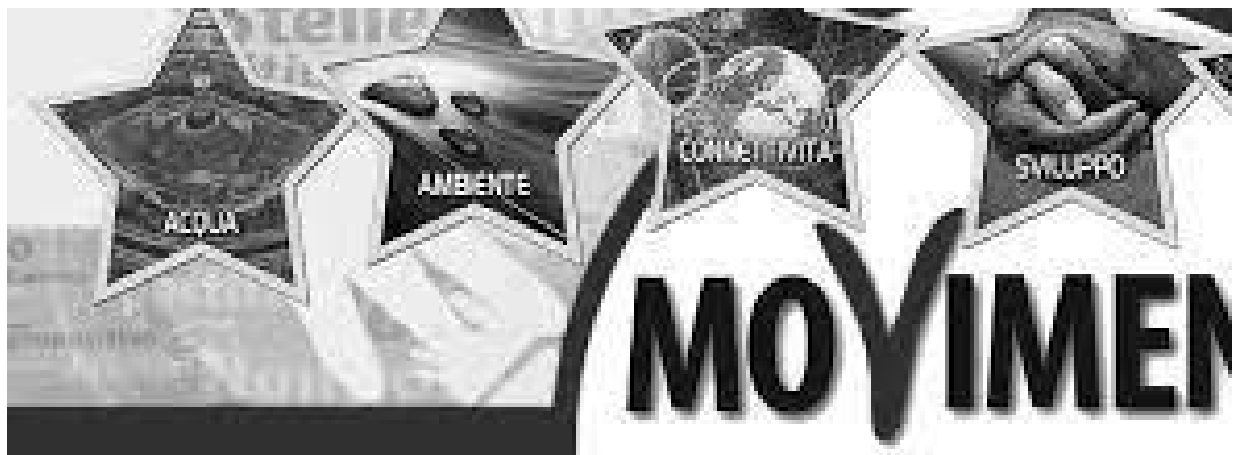
Мал. 1. – Пріоритети «Рух 5 зірок» на момент створення

На мал. 1 ми бачимо, які пріоритети на початковому етапі створення руху були виділені його активістами в ході спілкування на платформі. Абстрактних, властивих ідеології цінностей там немає (свобода-рівність-братерство), тільки конкретні цілі споживача.