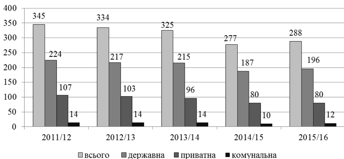
Рис. 2. Кількість ВНЗ України III-IV рівнів акредитації за формами власності станом на початок відповідного навчального року, од.

Спостерігається загрозлива тенденція до суттєвого зменшення абітурієнтів, причому більшість ВНЗ виявилися неготові до таких змін. Встановлено, що зменшення в державі кількості вищих навчальних закладів є наслідком впливу демографічної та економічної ситуації, а також відповідної державної політики (рис. 2).