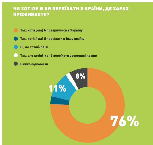
Рис. 2.4. Місце проживання респондентів

У дослідженні також розглянуто позицію молоді, яка перебуває за кордоном*. До України хочуть повернутися 76% молодих людей, які виїхали за кордон через війну. Зокрема, 64% планують повернутися до свого населеного пункту, в якому раніше проживали, і тільки 2% – вже до іншого, решта не визначились. Більше половина (57%) молоді за кордоном серед найважливіших цілей в житті зазначили бути корисними Україні [Аналітичний центр Cedos, 2023]. Нижче наведена інфографіка у рис. 2.4.