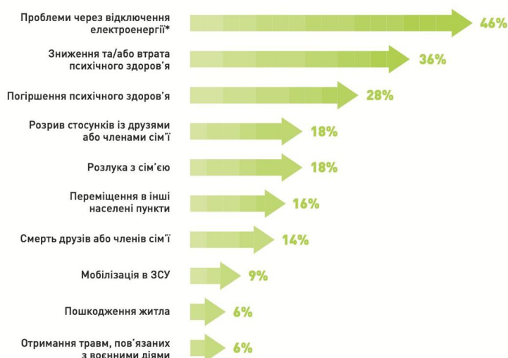
Рис. 2.3. Досвід респондентів