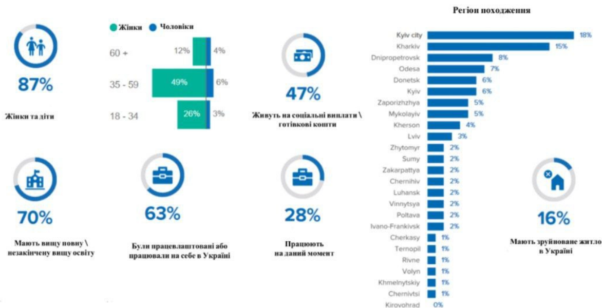
Рис. 2.2. Профіль вимушено переміщених осіб