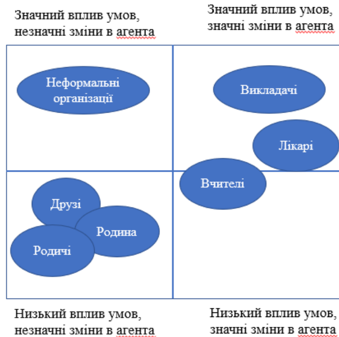
Рис. 2. Візуалізація ступеня впливу на агента соціалізації та зміни в його функціях

Схематично відобразити вплив сучасних умов на агентів соціалізації можна за допомогою наступною схеми: