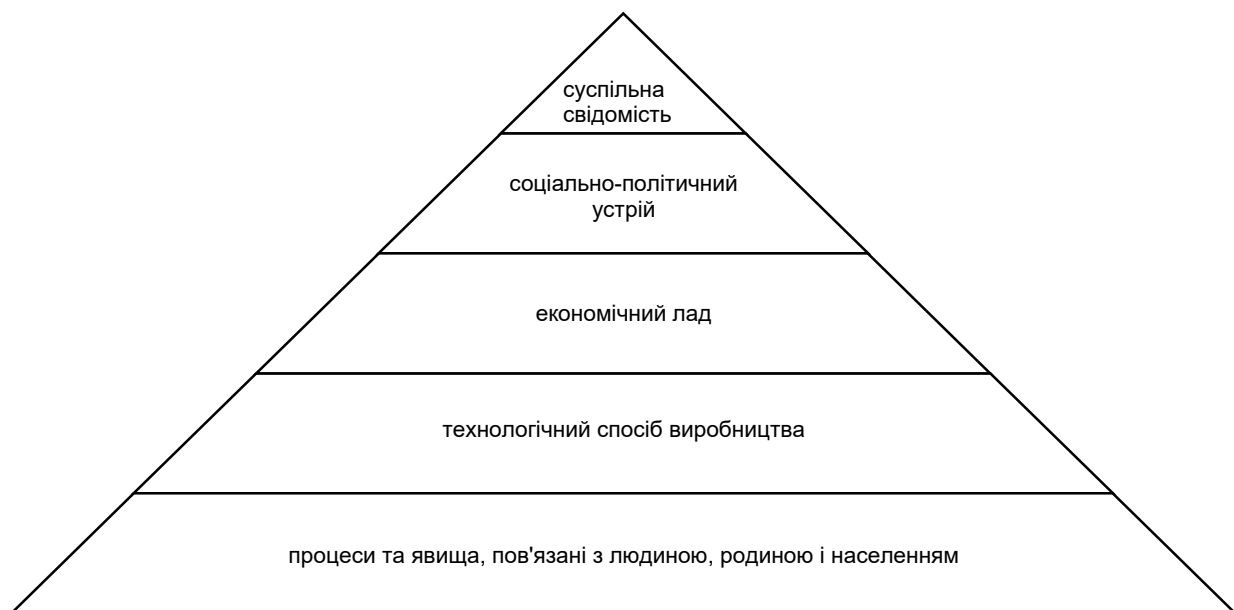
Рис. 1. Системна модель цивілізації

Очевидною є потреба у створенні механізмів забезпечення економічної стійкості та самостійності в контексті потужних глобалізаційних процесів та геополітичних викликів. Тимчасова втрата низки промислових регіонів завдала суттєвого удару не лише по економічній системі країни, але і по соціокультурному сектору. Вирішення цих проблем лежить у площині міждисциплінарного підходу та цивілізаційних вимірів. Господарська система будується не на абстрактних принципах ринкової взаємодії, а на економічних інтересах господарюючих суб'єктів, які приймають персонально рішення, керуючись доступною інформацією, інтерпретовану у відповідності до власної системи знань, морально-етичних норм та принципів поведінки. Те, як функціонує сьогодні економічна система України, є результатом функціонування інформаційно-культурного простору та адаптації економічних інститутів під нього.