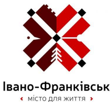
Рис. 2.2. Логотип бренду міста Івано-Франківськ