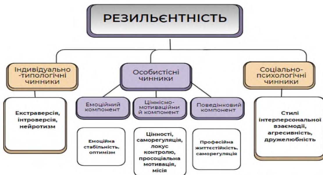
Рис. 1. Теоретична модель психологічних чинників резильєнтності

Соціально-психологічні чинники включають стилі міжособистісної взаємодії, рівень дружельюбності чи агресивності, які впливають на доступність соціальної підтримки, ефективність командної роботи та загальну здатність до адаптації в соціальному середовищі.