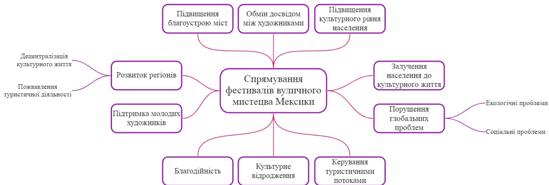
Схема напрямків діяльності фестивалів вуличного мистецтва Мексики