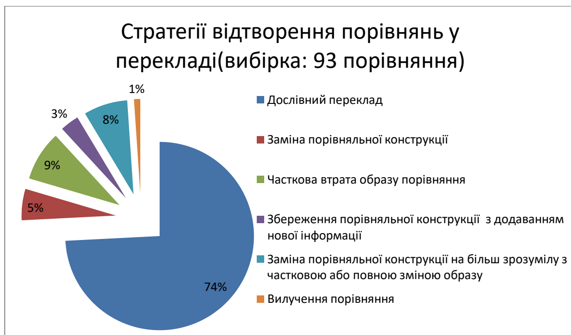
Рисунок 3 - Стратегії відтворення порівнянь у перекладі(вибірка: 93 порівняння)

У поетичних текстах Сергія Жадана переважають індивідуальні порівняння, які відображають високий рівень творчого мистецтва поета, глибину його почуття слова та оригінальність мовного виразу. Смісл таких порівнянь часто не відкривається зразу, і їх тлумачення вимагає великих зусиль і ретельного аналізу широкого контексту. Порівняльні звороти в творах Сергія Жадана свідчать про значну різноманітність у способах вираження.