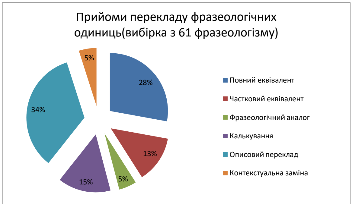
Рисунок 1 – Прийоми перекладу фразеологічних одиниць, аналіз вибірки з 61 фразеологізму

1. Фразеологічний еквівалент. Найкращим способом перекладу фразеології є використання відповідного фразеологізму в мові перекладу, оскільки це забезпечує не лише передачу смислу, а й відтворення образності та емоційного забарвлення, характерних для оригінального вислову. Фразеологічні еквіваленти можуть бути повні або часткові, при цьому у часткових еквівалентів може відбуватися зміна лексико-граматичної структури.