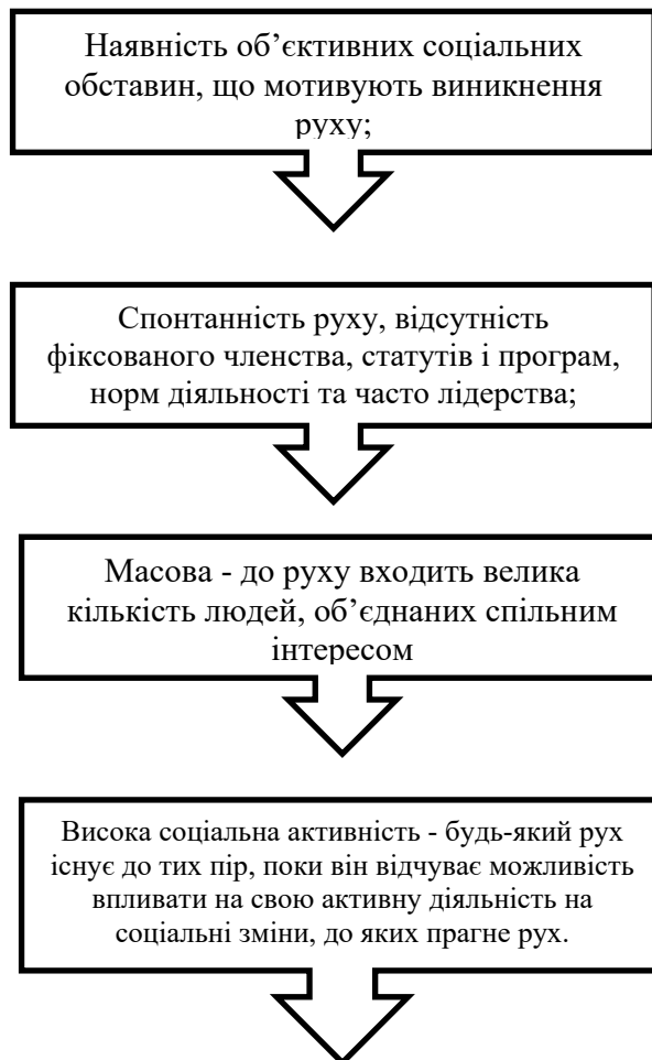
Рис. 1.1 – Характеристика соціальних рухів

Можна визначити характеристики будь-яких соціальних рухів незалежно від соціальної сфери, де відбувається їх діяльність. Цілі або завдання руху. Такі характеристики руху повинні включати, рис. 1.1.