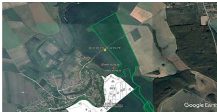
Рис. 2. Розміщення дослідних ділянок на території Національного природного парку "Подільські Товтри"

Також відмічено ряд видів: Sanicula europea L., Galeobdolon lutea Gilib., Hepatica nobilis Mill., Anemona ranunculoides L., Ficaria verna Huds., Isopirum talictroides L., Euphorbia amigdaloides L., Gagea lutea L., Pulmonaria officinalis L., Ranunculus cassubicus L., Dactylis glomerata L., Poa sylvestris A. Gray, Viola reichenbachiana Jord. ex Boreau, Coridalis cava Schweigg. et. Korte., Carex pilosa Scop.