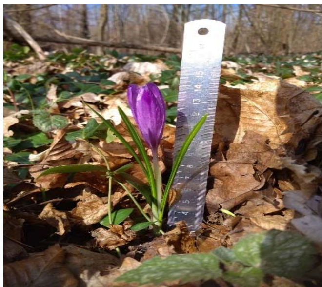
Рис. 1. Генеративна особина Crocus heuffelianus Herb

Національний природний парк "Подільські Товтри" – один із найбільших НПП України загальною площею 261316 га і розташований на території Хмельницької області. За геоботанічним районуванням одна частина Парку належить до Покутсько-Медоборського округу букових, грабово-дубових і дубових лісів, справжніх лук і лучних степів Південнопільської Західноподільської підпровінції, широколистяних лісів, луків, лучних степів та евтрофних боліт Центральноєвропейської провінції широколистяних лісів Європейської широколистянолісової області, а інша – до Центральноподільського округу грабово-дубових і дубових лісів і суходольних лук Української лісостепової підпровінції Східноєвропейської лісостепової провінції дубових лісів, остепнених лук і лучних степів Лісостепової підобласті Євразійської степової області [3]. На території НПП "Подільські Товтри" флористичне різноманіття нараховує близько 1500 видів вищих судинних рослин. Серед них 93 види реліктів, близько 30 ендемічних для України видів. На території парку перебуває під охороною 161 об'єкт природно-заповідного фонду (ПЗФ).