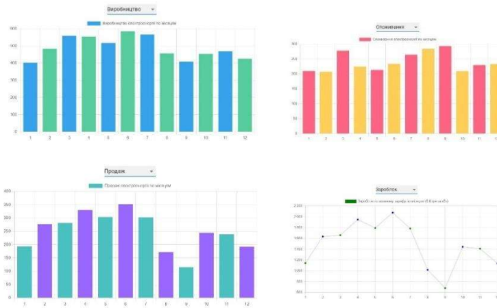
Рис. 3. Приклад графіків моніторингу даних

Для забезпечення моніторингу за параметрами споживання, генерації, купівлі та продажу електроенергії в застосунку використовують графіки з деталізованою статистикою, що надає змогу оператору якісно реагувати на потенційні проблеми (рис. 3).