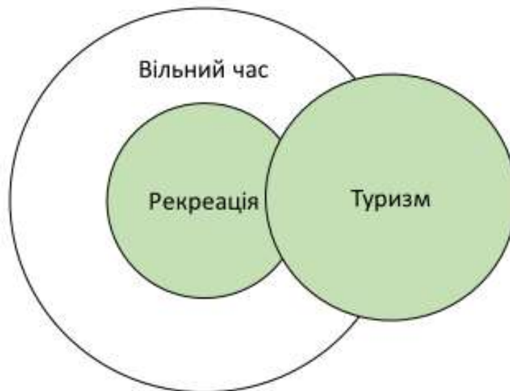
Рис. 1. Співвідношення між поняттями «вільний час», «рекреація» і «туризм» (Turystyka, 2007)

сил людини. Туризм як одна зі складових рекреації є способом задоволення потреб у зміні природного і культурного середовища та є соціальним фактом і психічним переживанням (Turystyka, 2007). Туризм часто ототожнюють з туристичним рухом, хоча це поняття є вужчим.