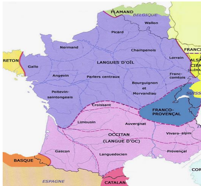
Les domaines linguistiques d'oïl et d'oc à l'époque de l'ancien français

Pour l'étude de l'ancien français, cette diversité dialectale est fondamentale. Elle explique la variation des formes observées dans les textes médiévaux, l'absence de norme fixe et la difficulté de parler d'un « ancien français unique ».