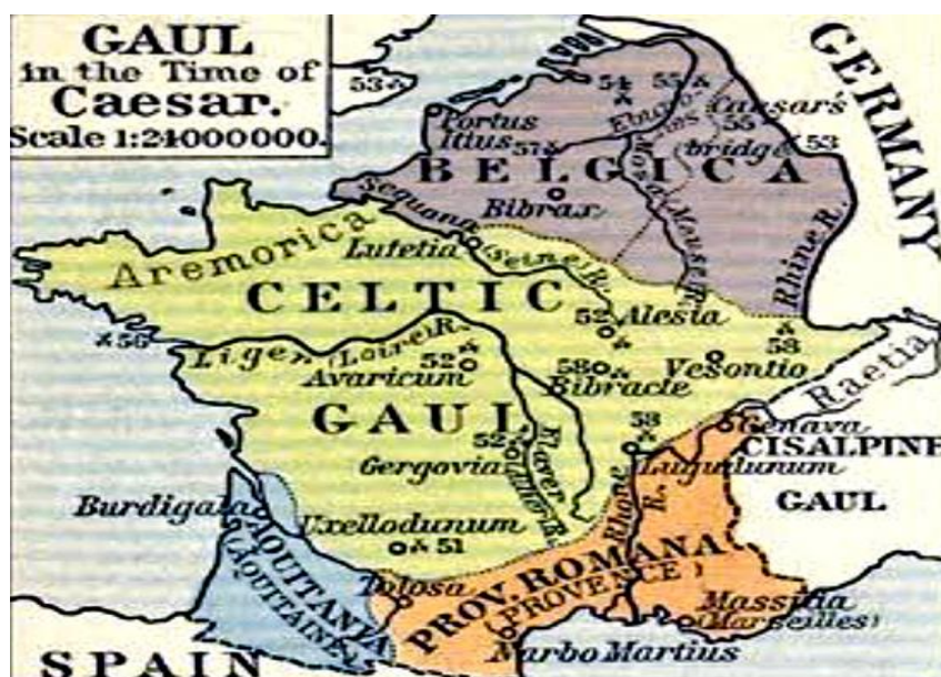
La Gaule celtique à l'époque de Jules Cesar (en vert)

Avant la conquête romaine, la Gaule est un territoire majoritairement celte, où l'on parle le gaulois , une langue indo-européenne appartenant à la branche celtique. Cette langue est essentiellement orale et coexiste avec une organisation sociale et culturelle propre aux peuples gaulois. La conquête de la Gaule par les Romains s'opère principalement entre 58 et 51 av. J.-C., au cours des campagnes militaires menées par Jules César. Lorsque les Romains conquièrent la Gaule au Ier siècle av. J.-C., le gaulois ne disparaît pas immédiatement. Pendant plusieurs siècles, il coexiste avec le latin, ce qui crée une situation de bilinguisme progressif .