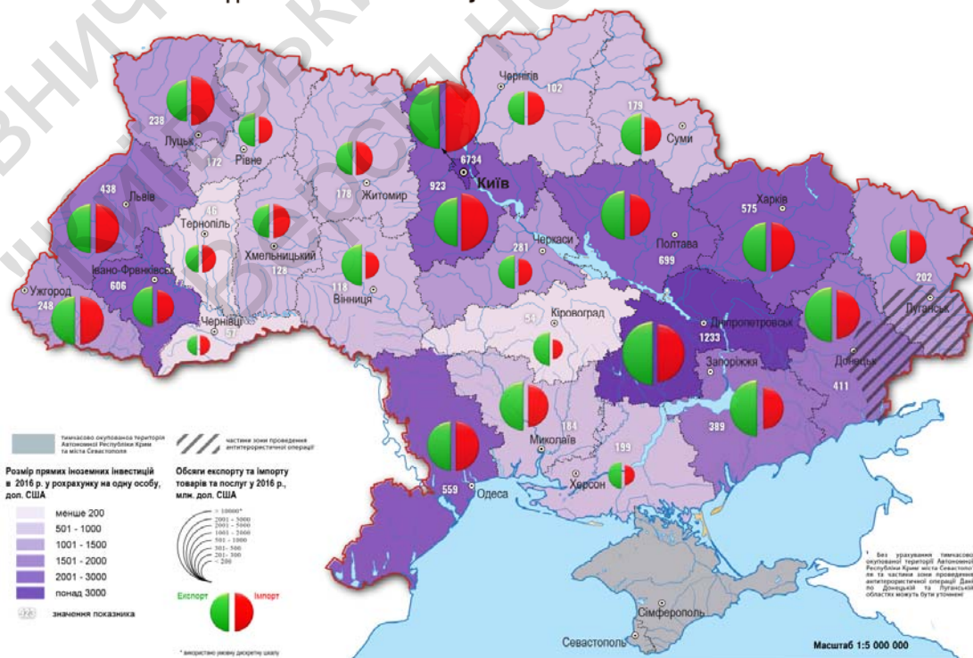
Рис. 1. Зовнішньоекономічна діяльність за регіонами України