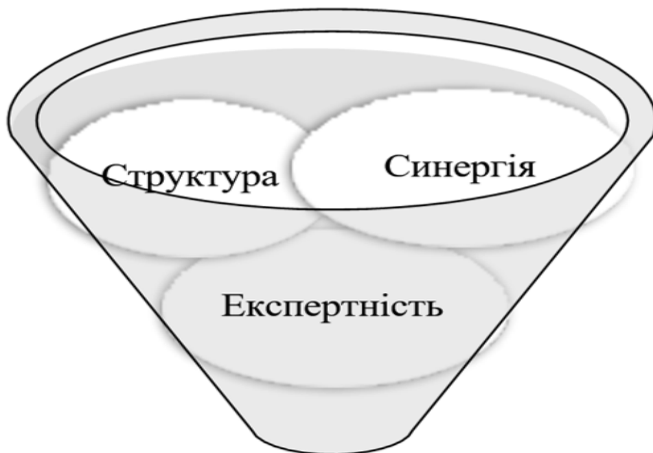
Рис. 1.3.2. Структура освітнього коучинга

Коучинг є спільним, двобічним процесом. Це означає, що коуч і здобувач, якого навчають, разом працюють над створенням змін. Коучинг є високоефективним засобом при роботі з тими, хто навчається, при врахуванні 3 унікальних компоненти (див. рис. 1.3.2).