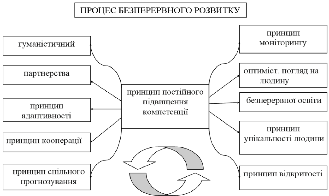
Рис. 1.3.1. Принципи безперервного розвитку особистості

Провідною ідеєю застосування вищезначених принципів є безперервний процес розвитку, вдосконалення, розкриття потенціалу особистості для досягнення максимального результату. Іншими словами – виявити та реалізувати потенціал особистості; навчити використовувати всі можливі ресурси для досягнення успіху; знаходити оптимальний варіант ідії, що дає змогу при мінімальних зусиллях досягати максимального результату.