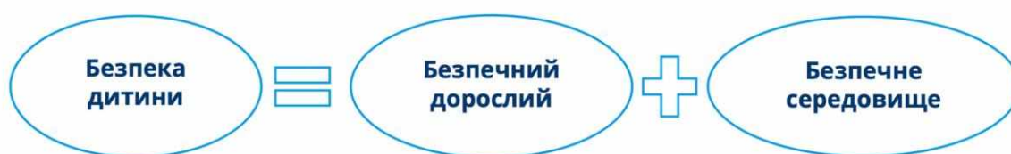
Рис. 2.1. Формула безпеки дитини

Батькам важливо усвідомлювати, що є безпекою для дитини та як стати для неї надійною опорою (рис. 2.1) [24].