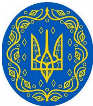
Рис. 3. Великий державний герб УНР за проектом Василя Кричевського (1918).

них цінностей минулого. У графіці поєднувалися різні естетичні моделі: «неовізантійська», «читальна», «псевдоетнографічна», а також «обірвана» традиція книжкової графіки козацької доби. Водночас мистецька мова набуває рис модерної стилізації, що виявляється у формі лінії, площинності, декоративно-площинному розумінні композиції.