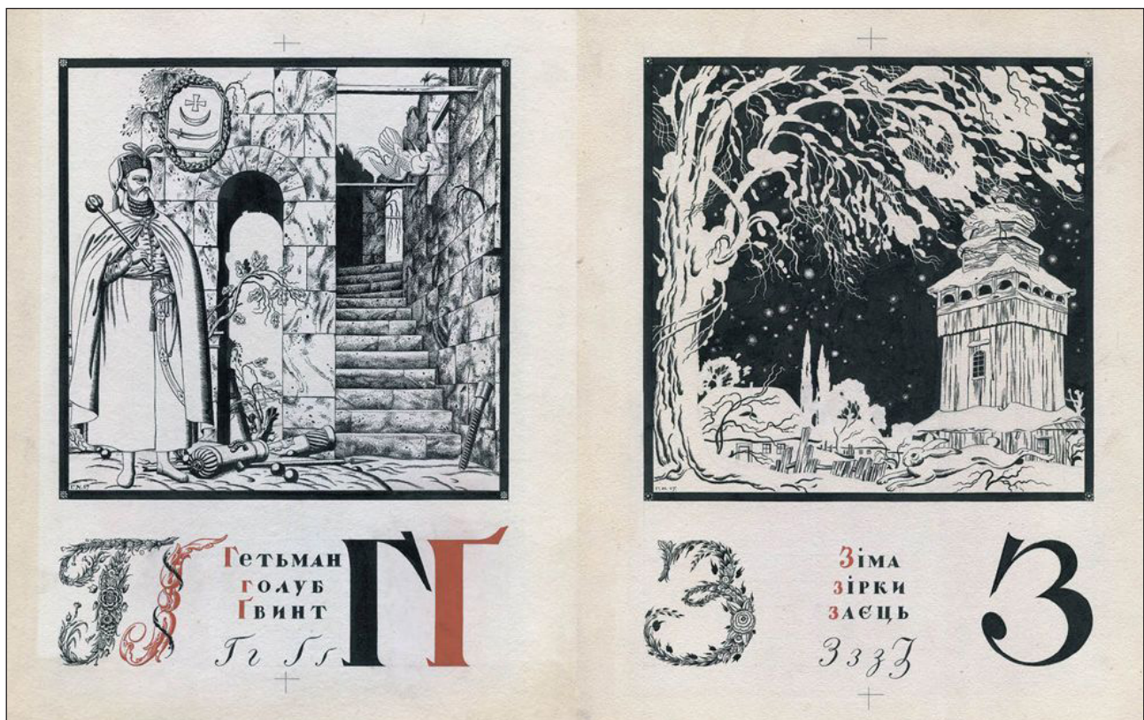
Рис. 2. Г. Нарбут «Українська абетка» (1917).