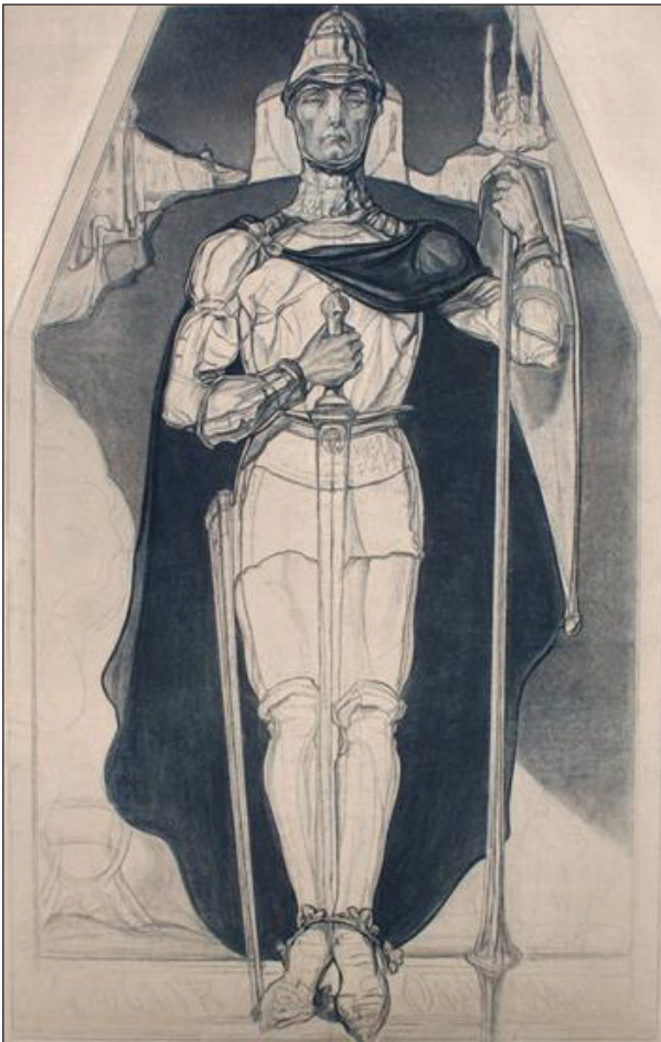
Рис. 5. О. Новаківський. Ярослав Осмомисл, воїн (1919).

У період 1900-х – 1930-х років різні загальноєвропейські течії знайшли своє відображення в українській графіці (Історія 2007, с. 132–175). Модерністські течії в українському графічному мистецтві вказаного періоду представляли Олександра Екстер, Анатоль Петрицький, брати Бойчуки та ін., які сміливо експериментували з формою, кольором, світлом. Пластичне мистецтво Олександра Архипенка перепліталось з графічними пошуками ідеї тривимірності на