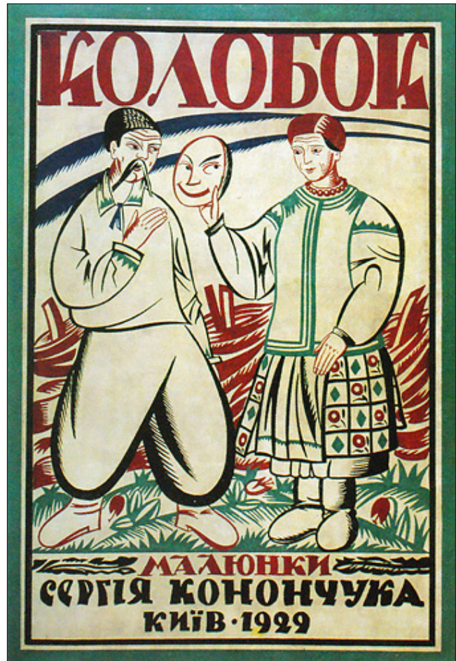
Рис. 6. С. Конончук. Ілюстрація до української народної казки «Колобок» (1929).