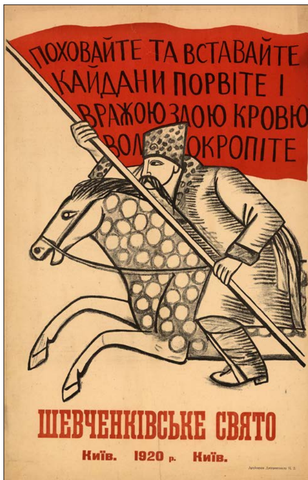
Рис. 4. М. Бойчук. Шевченківське свято (1920).

У 1920-х – 1930-х роках графіка в Україні розвивається в напрямках високої розмаїтості: вона охоплює широкий спектр тем, жанрів і технік. У художніх навчальних закладах Києва, Харкова, Одеси, а також у приватних студіях, зокрема, студії Олекси Новаківського у Львові, активно працюють художники нового покоління. Саме у цей період в Україні формуються основи сучасної школи художників-графіків.