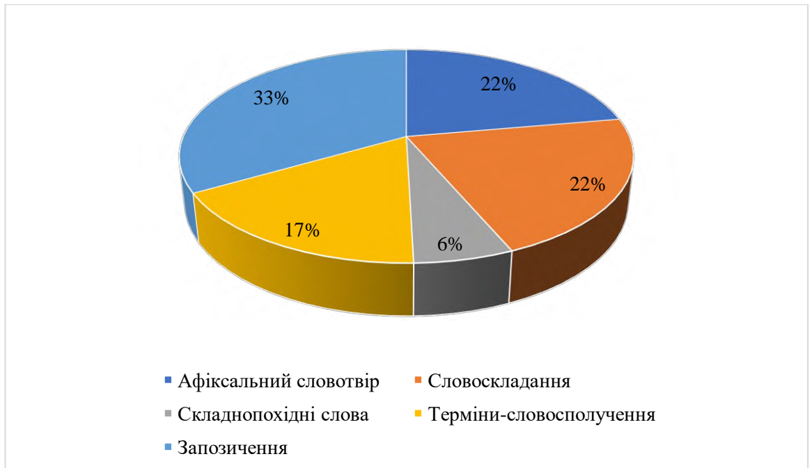
Рис. 2.2. Кількісне співвідношення різних типів економічних термінів СКМ

Менш продуктивними, натомість, є група термінів-словосполучень, яка становить 17%, а найменш представлена група економічних термінів – це складнопохідні слова, частка яких від загального числа прикладів становить лише 6%.