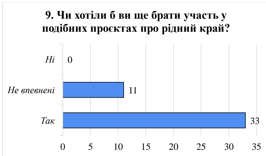
Рис. 3.12. Готовність учнів до участі в майбутніх краєзнавчих дослідженнях [складено автором]

Більшість опитаних учнів позитивно оцінили уроки географії з використанням краєзнавчих методів: 18 школярів вказали, що їм було «дуже цікаво», ще 16 – що було «добре» (рис. 3.13). Лише 4 респонденти обрали варіант «звичайно», і жоден не зазначив, що було нецікаво. Це свідчить про високий рівень зацікавленості учнів у такому форматі навчання, а також про те, що краєзнавчі підходи сприяють залученню та емоційній включеності школярів у зміст географічної освіти.