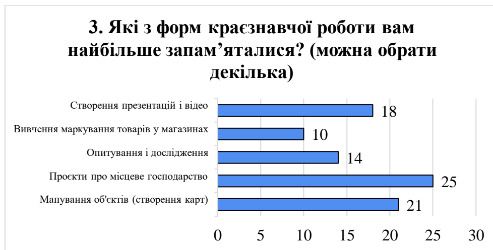
Рис. 3.6. Форми краєзнавчої роботи, які найбільше запам'ятались, за версією учнів [складено автором]

Формою краєзнавчої роботи, яка найбільше запам'яталась, для учнів стали проекти, пов'язані з місцевим господарством – їх відзначили 25 школярів (рис. 3.6), що свідчить про високий рівень зацікавлення темами, які безпосередньо пов'язані з економічною реальністю регіону. Значну частину учнів також зацікавили мапування об'єктів (21 відповідь) та створення презентацій і відео (18 відповідей), що вказує на ефективність візуальних і креативних підходів. Менш популярними виявилися опитування й дослідження (14) та вивчення маркування товарів (10), хоча і ці форми залишилися в полі інтересу частини учасників. Такий розподіл демонструє, що найбільший резонанс викликають завдання, які поєднують реальність, практичну значущість і творчість.