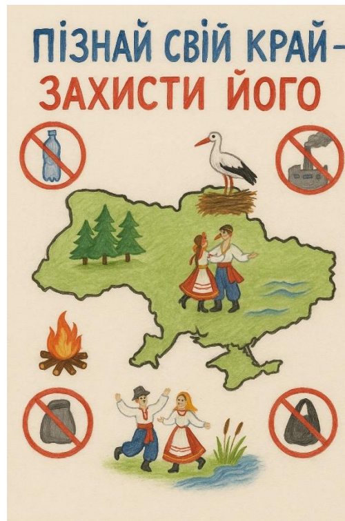
Рис. 1.1. Приклад плакату учнівського проєкту «Пізнай свій край – захисти його» [складено автором]

Саме завдяки географічному краєзнавству учень вчиться не лише помічати деталі навколо себе, а й розуміти, як вони впливають на глобальні процеси. Через вивчення локального – фауни прилеглого лісу, структури мікрорайону, історії старої вулиці чи господарської діяльності в межах громади – формується здатність мислити в категоріях масштабності, просторових зв'язків і причинно-наслідкових залежностей. Це те саме просторове мислення, яке стає ключовою компетентністю у XXI столітті, коли людина повинна не лише орієнтуватися на місцевості, а й бачити світ як систему взаємопов'язаних середовищ.