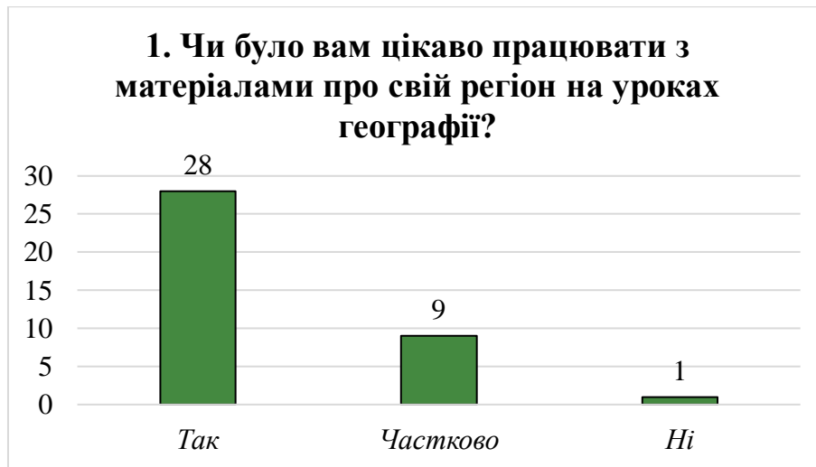
Рис. 3.4. Зацікавленість учнів у вивчення краєзнавчих матеріалів [складено автором]

Більшість учнів (31 з 38) визнали, що використання прикладів із їхнього міста чи району суттєво полегшило розуміння навчального матеріалу (рис. 3.5). Ще 6 респондентів зазначили, що це допомогло частково, що також свідчить про позитивний ефект локалізації знань. Лише один учень не відчув жодної користі від краєзнавчого підходу, що може бути пов'язано з індивідуальними особливостями сприйняття або зацікавленням у предметі. Загалом, результати демонструють високу ефективність прив'язки навчального змісту до знайомого учням середовища.