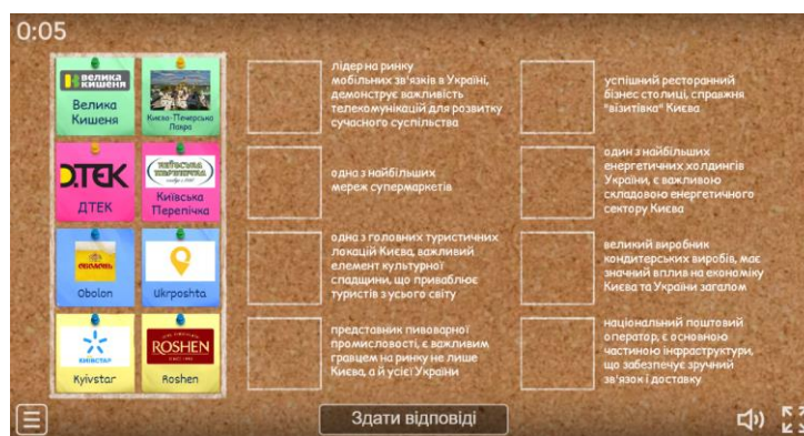
Рис. 3.1. Вигляд інтерактивної вправи «Місцеві бренди Києва» [складено автором за [1]]

Завдання складається із серії логічних вправ, у яких учням пропонується встановити відповідність між місцевими брендами Києва та їх логотипами. Важливим аспектом є асоціативний підхід до запам'ятовування інформації: учні мають не лише вивчити назви брендів, але й ознайомитись із специфікою кожного з них, що дає можливість кращого розуміння економічної діяльності на локальному рівні (рис. 3.1).