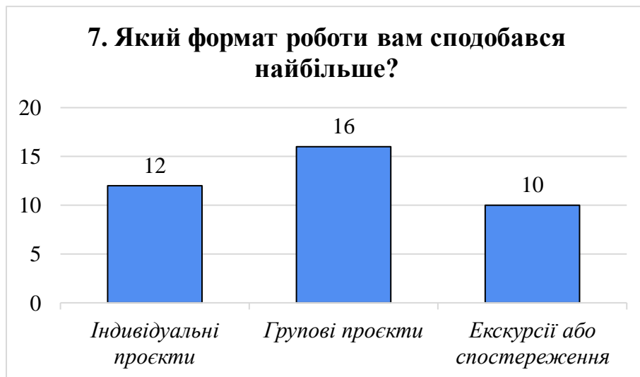
Рис. 3.10. Улюблені формати краєзнавчої діяльності: погляд учнів

Найпопулярнішим форматом серед учнів стали групові проекти, які обрали 16 із 38 респондентів (рис. 3.10). Це свідчить про важливість соціальної взаємодії та співпраці у навчальному процесі: учні відчують себе впевненіше, коли працюють у команді, обмінюються ідеями та розподіляють завдання. Індивідуальні проекти отримали 12 голосів, що також засвідчує наявність учнів із високим рівнем автономії та внутрішньої мотивації. Екскурсії та спостереження обрали 10 школярів, і хоча цей формат посів третє місце, його результати демонструють сталий інтерес до практичного досвіду й навчання в реальному середовищі. Таким чином, різноманітність форматів забезпечує залучення учнів із різними стилями навчання.