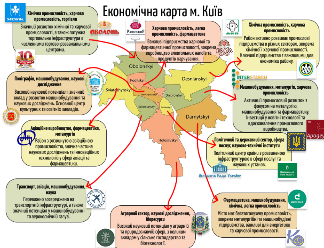
Рис. 3.3. Плакат проєкту «Економічна карта м. Київ», виконаний учнями 9 класу [складено автором]

На рисунку 3.3 зображено результат виконання проєкту – плакат, створений учнями школи в рамках виконання завдання з теми «Економічна карта м. Київ». Плакат відображає основні галузі господарства столиці, а також демонструє важливість кожного району в економічній структурі міста. Створення карти стало чудовим способом інтеграції теоретичних знань з географії та економіки, дозволивши учням візуалізувати економічні процеси на території Києва. Проєкт не лише покращив їхні знання в галузі економіки, але й розвивав навички роботи з інформацією, критичного мислення та здатність презентувати свої результати у формі зрозумілого та інформативного матеріалу.