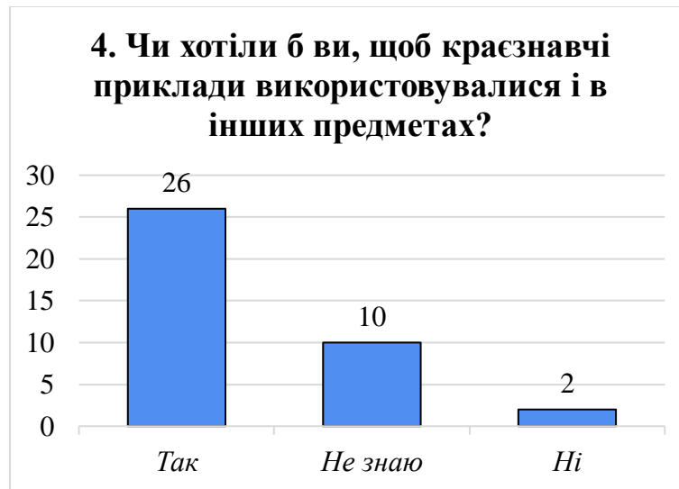
Рис. 3.7. Доцільність використання краєзнавчого підходу на інших навчальних предметах: думка учнів [складено автором]

вважають, що така інтеграція недоцільна, що можна трактувати як виняток, а не тенденцію.