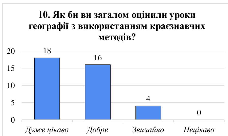
Рис. 3.13. Рівень зацікавленості учнів у краєзнавчих уроках географії [складено автором]

Більшість опитаних учнів позитивно оцінили уроки географії з використанням краєзнавчих методів: 18 школярів вказали, що їм було «дуже цікаво», ще 16 – що було «добре» (рис. 3.13). Лише 4 респонденти обрали варіант «звичайно», і жоден не зазначив, що було нецікаво. Це свідчить про високий рівень зацікавленості учнів у такому форматі навчання, а також про те, що краєзнавчі підходи сприяють залученню та емоційній включеності школярів у зміст географічної освіти.