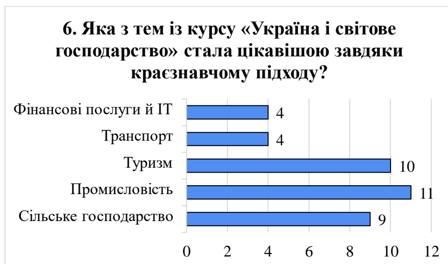
Рис. 3.9. Інтерес учнів до тем курсу, поглиблений через краєзнавчий підхід [складено автором]

Найбільшу зацікавленість учнів викликала тема «Промисловість» – 11 школярів зазначили, що саме вона стала для них цікавішою завдяки краєзнавчому підходу (рис. 3.9). На другому місці – тема «Туризм» (10 відповідей), що свідчить про природний інтерес учнів до дослідження знайомих локацій. Тема «Сільське господарство» також отримала високі показники – 9 відповідей, особливо серед учнів, які мають досвід родинного ведення господарства.