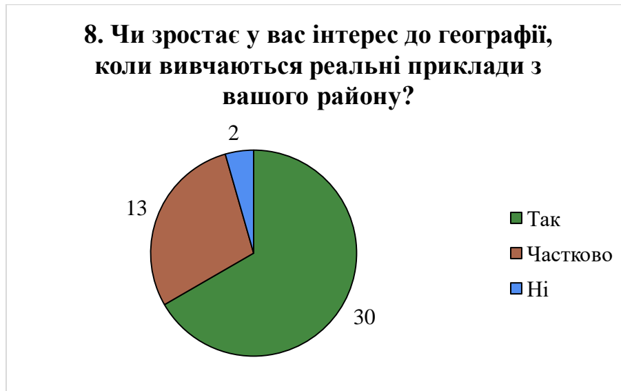
Рис. 3.11. Вплив локальних прикладів на зацікавленість учнів географією [складено автором]

школярів відповіли, що ці приклади частково сприяють зростанню зацікавленості, і лише 2 учні не відчували змін. Така динаміка підтверджує, що локальний контекст навчання викликає в учнів емоційний відгук, робить знання більш зрозумілими, а навчальний процес – більш значущим і мотиваційним.