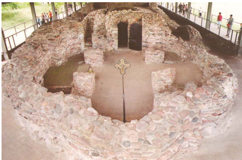
Рис. 2. Руїни церкви і палацу на о. Ледниця [74, с. 33]