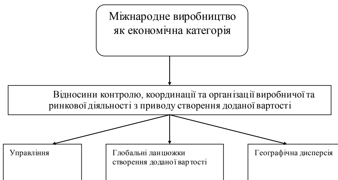
Рис. 1. Базові характеристики міжнародного виробництва ТНК як економічної категорії