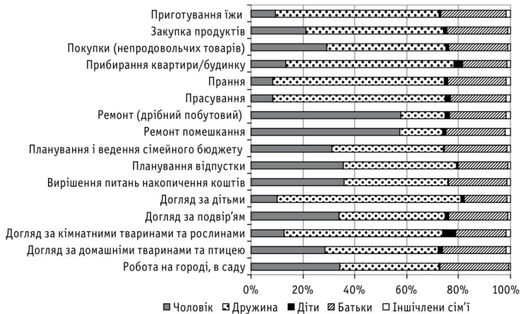
Мал. 3 Основні виконавці домашніх обов'язків (за їх різновидами) у сім'ях респондентів, % (Джерело: Інститут демографії та соціальних досліджень НАН України, 2009)

Для країн з перехідною економікою, як Україна, процес трансформації проходить нерівномірно і може мати свої негативні наслідки (сирітство, матері-одиначки, які потребують державної допомоги тощо). Через демографічну та економічну кризи, а також через національні традиції трансформація сім'ї відбувалась непослідовно, частково. В умовах економічної кризи 1990-х років до сім'ї певною мірою повернулись ті функції, які вже були «делеговані» іншим інститутам суспільства. Наприклад, скорочення у 1990–1999 роках частки дітей, охоплених дитячими дошкільними закладами, з 57% до 38%, що свідчить про недовіру суспільним організаціям і підвищення захисної функції [15].