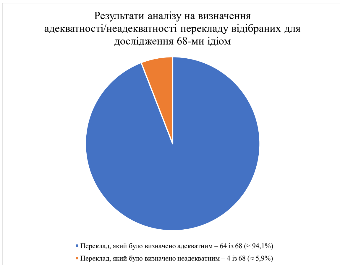
Графік 1. Результати аналізу на визначення адекватності/неадекватності перекладу відібраних для дослідження 68-ми ідіом