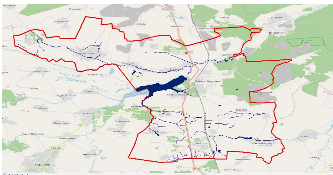
Рис.3.2.1. Новоборівська ОТГ та водні формації, що містяться в її межах

На рисунку представлена Новоборівська ОТГ, продемонстровано її чіткі межі, наявність, кількість та місце розташування водних об'єктів, що вона має на своїй території.