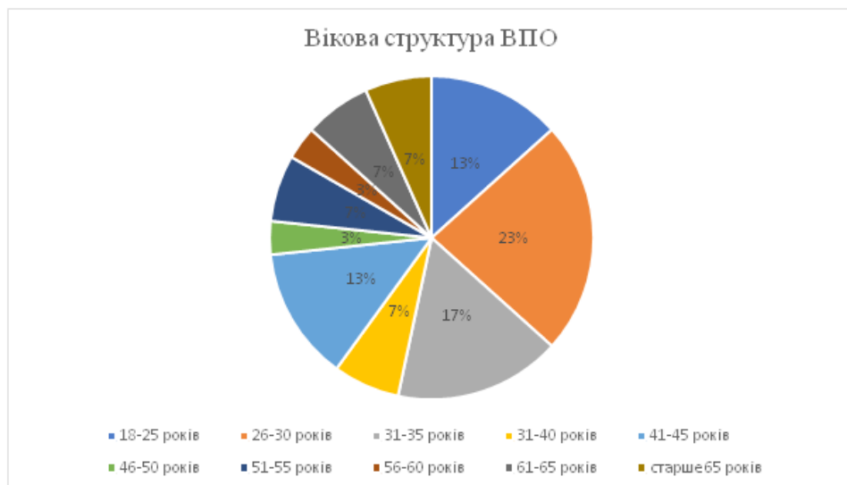
Рис. 1. Вікова структура серед ВПО на момент анонімного опитування. *Складено автором за даними анонімного опитування

Співробітники медичної сфери також зазначали, що вони намагалися виїхати в перші дні окупації через можливі наявні коридори. При цьому були змушені приховувати свою професійну діяльність через «фільтрацію» з боку російських військових, оскільки медиків дуже часто не пропускали на виїзд з окупованого регіону. Приватні підприємці вказали, що з боку окупаційної влади та військового