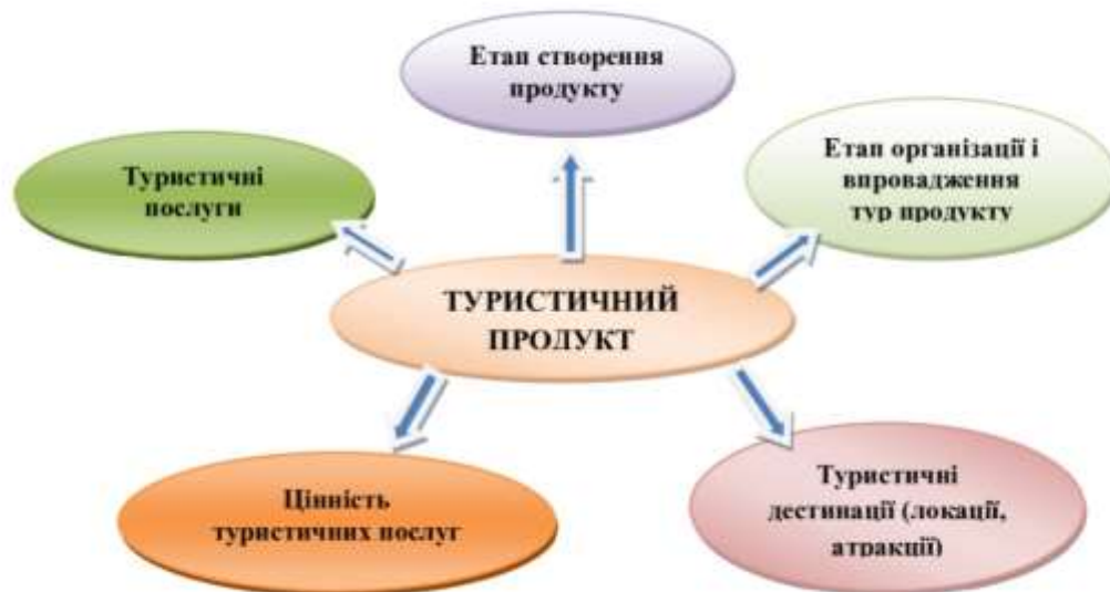
Рис. 2. Базові елементи туристичного продукту

Таким чином, місто повинно надавати не тільки високоякісний туристичний продукт, але й повинно бути пристосованим до організації масових (міжнародних) процесів у сфері туризму, виконувати необхідні умови безпеки і комфортності, пропагувати традиції, звичаї, уклад життя, колорит своєї країни, на фоні прояву поваги до них. Київ, як столиця України, виконує низку важливих функцій, виступаючи як атракція, як місто зі значною масою додаткових послуг (ресторани, нічні клуби, розваги та ін.), як великий транспортний вузол, як комплексна система різноманітних туристичних об'єктів. Туристичний продукт повинен бути цікавим для максимальної кількості людей (масовий споживач), визначатись гнучкою вартістю послуг, де споживчі вартості туристичного продукту обмінюються на споживчі вартості інших товарів (рис.2) [3].