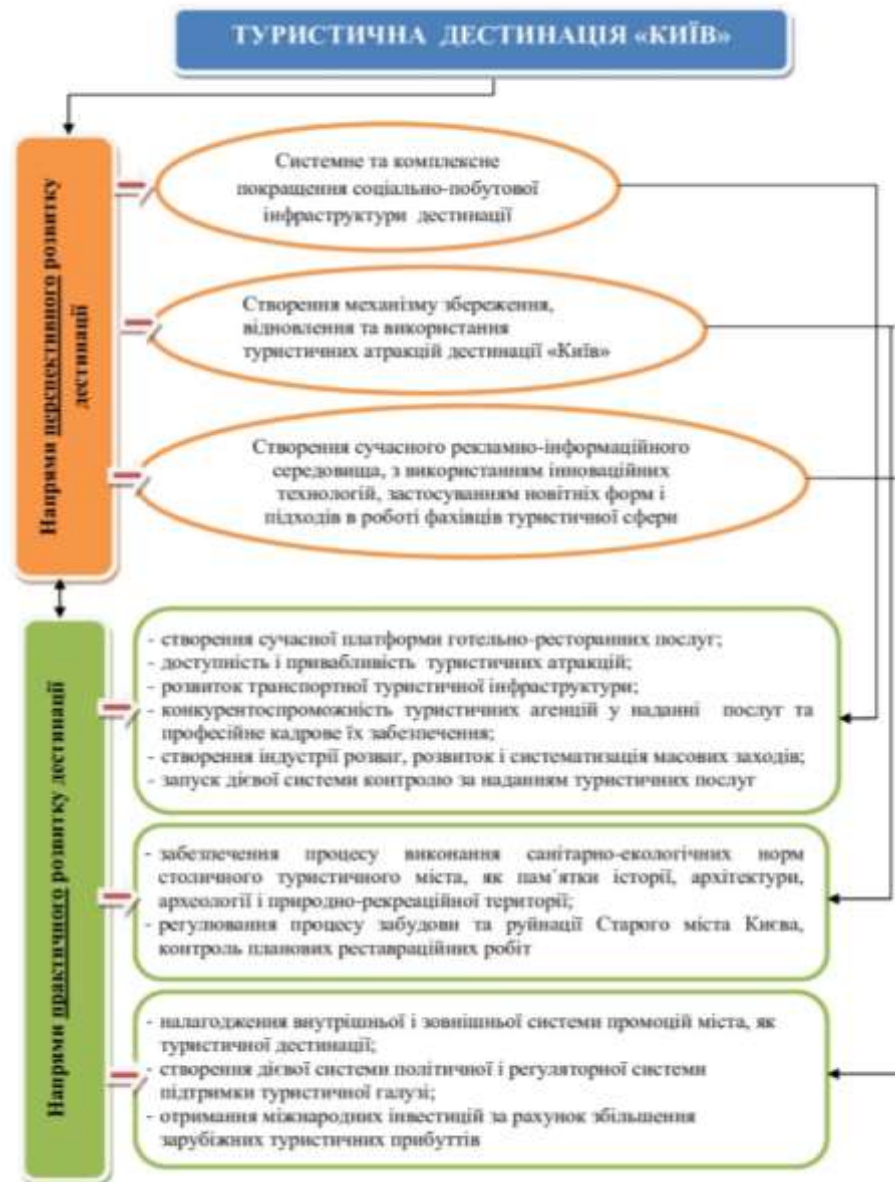
Рис.1. Структурно-логічна схема розвитку туристичної дестинації «Київ»

Вклад основного матеріалу дослідження. Зарубіжний досвід управління міськими дестинаціями на ринку туристичних послуг на основі проектів «Смарт місто» (концепції «Смарт місто» знайшла своє відображення в Німеччині, Китаї, Іспанії, ОАЕ) доводить перспективність впровадження інноваційних розробок і підходів, які здатні підвищити кількісно-якісні показники надання послуг в туристичній галузі та збільшити кількість прибуттів іноземних туристів до України.