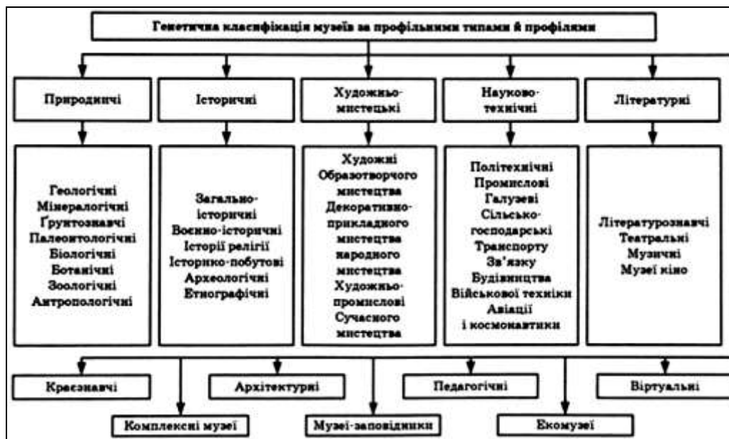
Рис. 1. Генетична класифікація музеїв за профільними типами й профілями [17]

музейних предметів та музейних колекцій з науковою та освітньою метою, залучення громадян до надбань національної та світової культурної спадщини [16]. Традиційні (класичні) музеї зазвичай поділяють на такі групи: природничі, історичні, художньо-мистецькі, науково-технічні, літературні, краєзнавчі, архітектурні, педагогічні, віртуальні та ін. (рис. 1). Музеї-заповідники позиціонуються як групи музеїв комплексного типу, що володіють особливою цінністю й отримали статус заповідників згідно з постановами урядових органів країни.