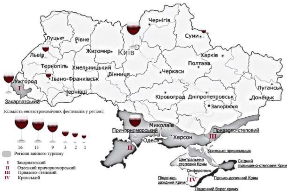
Рис. 2. Еногастрономічні фестивалі України за 2018 р.

Також, у вересні 2018 р. у Вилково проходив уперше еногастрономічний фестиваль «Дунайський гостини», у межах якого органічно було поєднано винні та гастрономічні локальні традиції, створено гучний інформаційний посил, встановивши рекорд з приготування 5 тон знаменитої «Вилківської юшки». Щорічні фестивалі стають об'єктами туристичного тяжіння та починають приваблювати увагу не тільки індивідуальних туристів, а й туристичних операторів, які успішно збирають туристичні групи. Крім того, такі фестивалі беруть участь в туристичних виставках, рекламуючи себе. Місцеві спільноти починають розуміти, що речі, які для них є звичними, для жителів міст та інших регіонів – дивина, і це можна продавати, на цьому можна будувати розвиток туристичних маршрутів.