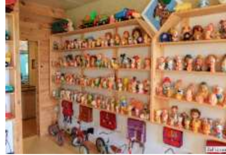
Рис. 2 Колекції музею «Ремісничий двір»

Висновки і перспективи дослідження. Охарактеризувавши та проаналізувавши туристичні ресурси Житомирської області видно, що Житомирщина має досить значну ресурсну базу для приваблення сучасного туриста та розширення цільової аудиторії. Адже сучасному вимогливому туристу хочеться цікаво і змістовно проводити час з зануренням в історію та побут українців, їх обрядів та звичаїв, яких вони дотримувалися протягом століть. Тому на сучасному етапі при створенні і формуванні якісного та прибуткового екскурсійного туристичного продукту в регіоні потрібно врахувати різні інтереси та вподобання туристів.