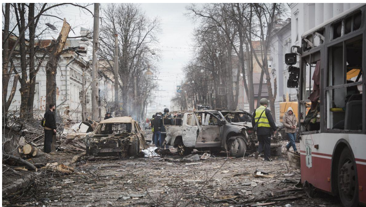
Рис. Б.2. Наслідки військових дій у містах Сумської області (джерело [20])