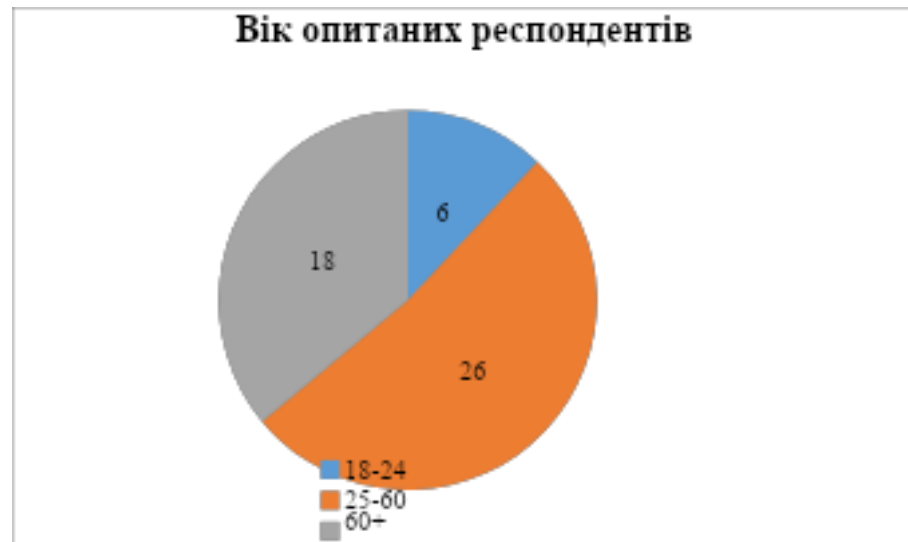
Рис 2.2. Вікова структура респондентів

Більшість опитаних — це мешканці міста Конотоп, яке зазнало значного впливу з початку повномасштабної війни, проте продовжує залишатися важливим соціальним та економічним центром південної Сумщини. Крім того, до вибірки були включені й внутрішньо переміщені особи (ВПО), які наразі проживають у регіоні. Їхній досвід є надзвичайно важливим для комплексного розуміння ситуації, оскільки вони одночасно стикаються як з викликами інтеграції, так і з питаннями безпеки, житла та працевлаштування. Такий склад вибірки забезпечив репрезентативність і дозволив сформуванню більш повну картину соціальних настроїв населення Сумщини в умовах війни.