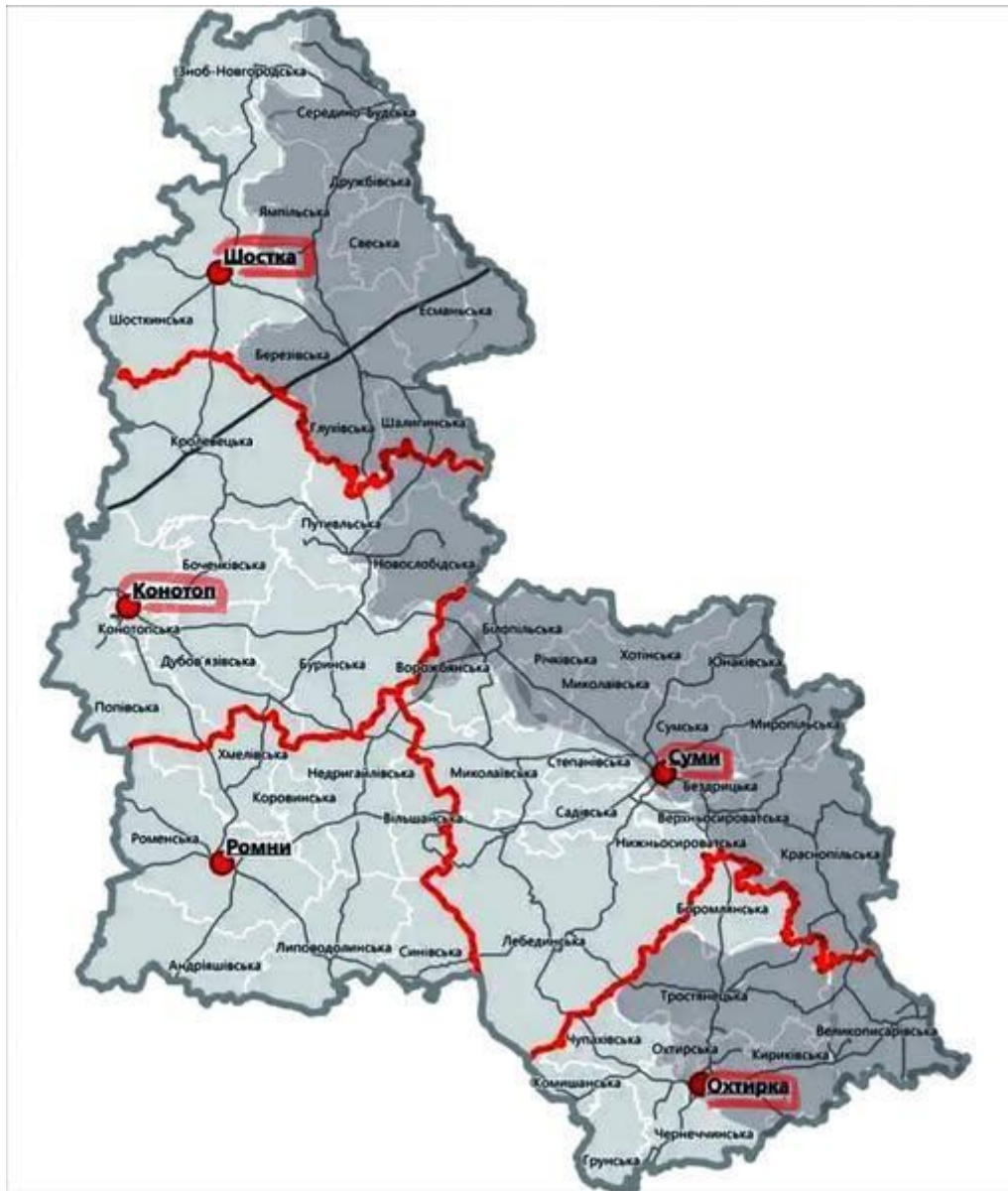
Рис. 2.1. Територіальні громади Сумської області, з яких евакуюють населення

Станом на весну 2025 року фіксується посилення ворожої активності по всій лінії державного кордону області. За повідомленнями керівництва Сумської ОВА, російські диверсійно-розвідувальні групи намагаються проникати на територію Сумщини в межах майже всієї прикордонної смуги — від Шосткинського до Охтирського району. Водночас спостерігається зосередження нових резервів противника біля кордону, що свідчить про підготовку до подальшої ескалації. У прикордонній зоні зростає інтенсивність артилерійських обстрілів і застосування безпілотних літальних апаратів. У