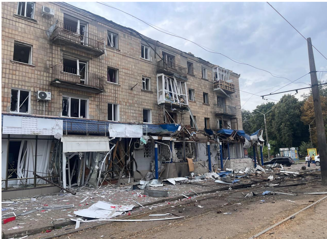
Рис. А.1. Наслідки військових дій у місті Конотоп Сумської області