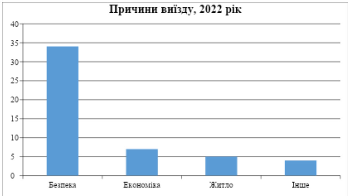
Рис 2.3. Причини виїзду мешканців з Сумської області у 2022 році

У 2024–2025 роках причини виїзду залишаються частково пов'язаними з економічними труднощами та нестабільністю, але також з'явилися нові фактори, як-от відсутність стабільних робочих місць і низький рівень соціальних послуг, особливо в прикордонних районах.