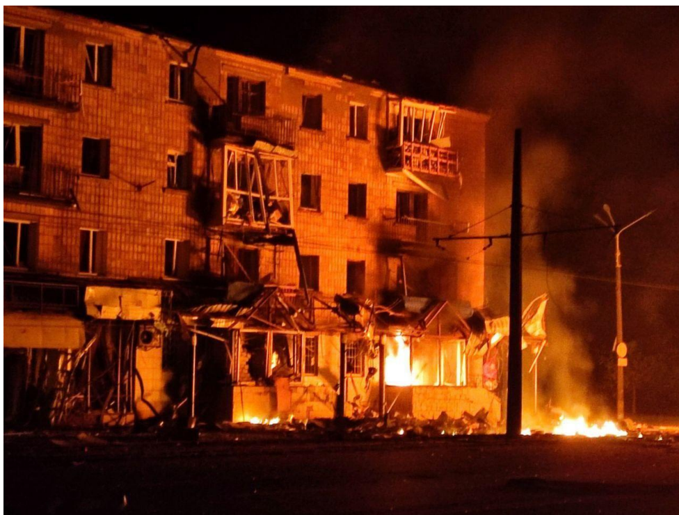
Рис. А.2. Наслідки військових дій у місті Конотоп Сумської області