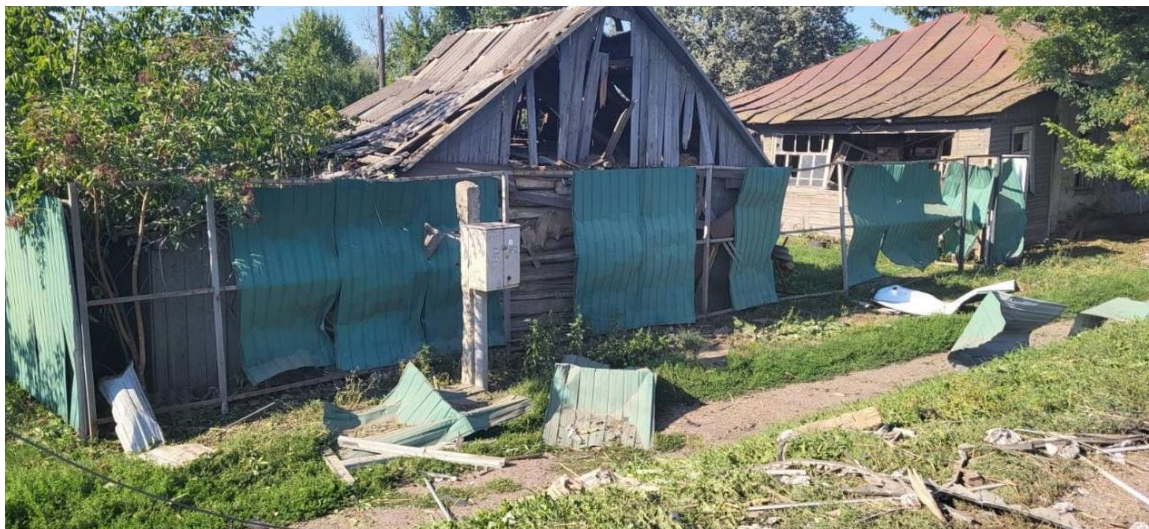
Рис. Б.1. Наслідки військових дій у сільській місцевості Сумської області