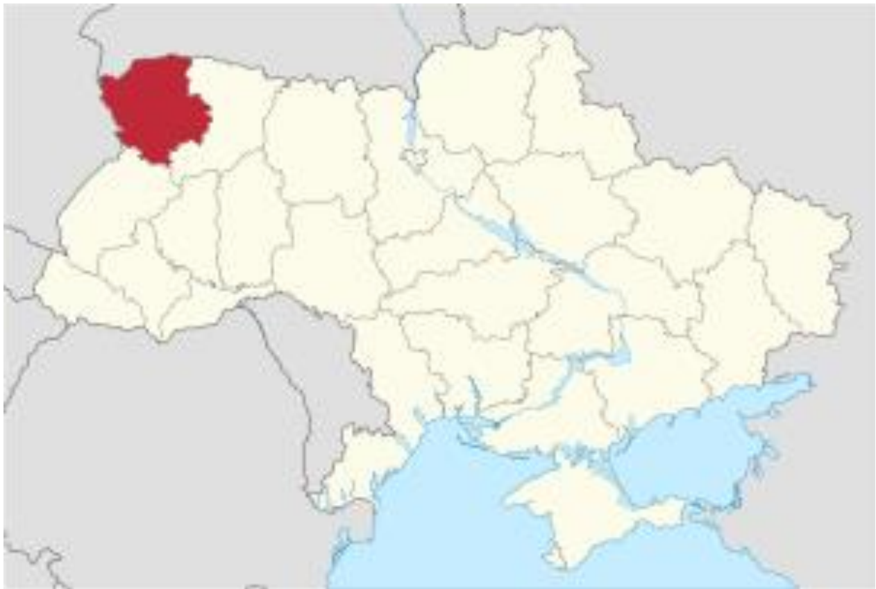
Рис. 2.1. Географічне положення Волинської області

Волинська область розташована у північно-західній частині України, на землях, що мають багату історію волинян. Заселена з давніх часів, ця територія була частиною Київської Русі у 10-12 століттях, а згодом – Галицько-Волинського князівства. Після Люблінської унії у 1569 році Волинь увійшла до складу Польської корони, а від 1793 року – до Російської імперії. У 20 столітті територія пережила багато змін, включаючи німецьку окупацію та входження до складу УРСР.