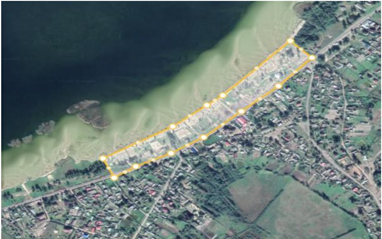
Рис. 3.1 Територія центрального пляжу у селі Світязь

Облаштована зона проведення подій. На цьому пляжі є готова територія для проведення фестивалів, де щорічно відбуваються спортивні та рекреаційні події. Тому на цій території вже є різні спортивні майданчики та облаштовані зони, що може зекономити додаткові витрати.