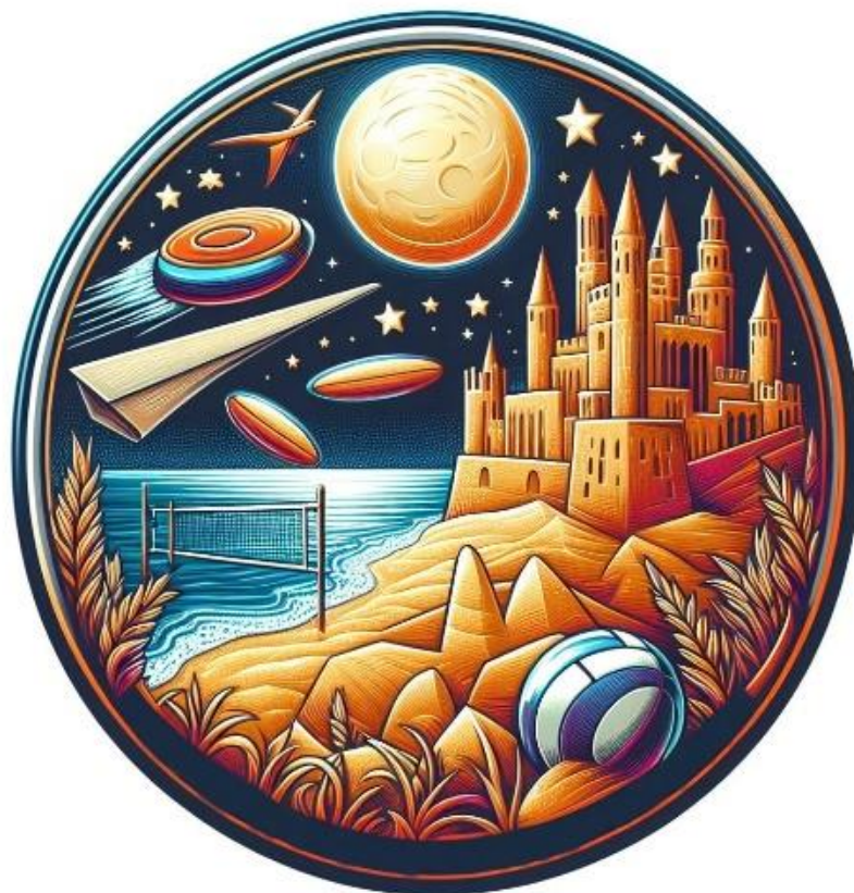
Рис. 3.2 Емблема фестивалю «Вітер та пісок»

Отже, фестиваль «Вітер та пісок» – це не лише захоплюючі спортивні змагання, але і можливість знайти гармонію між тілом та душею на природі, надихаючись красою навколишнього середовища та спільними досягненнями з командою.