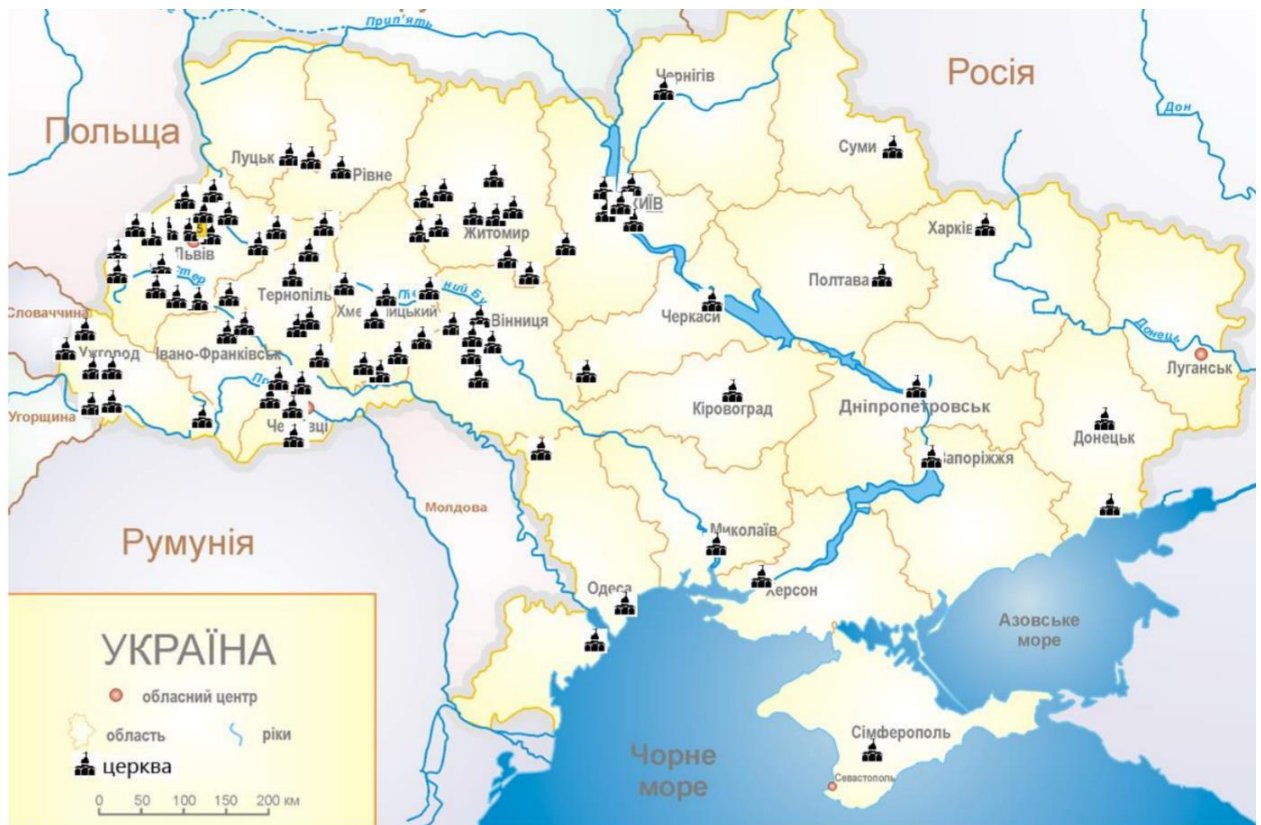
Рис.1. Розміщення храмів України, де були відкриті Двері Божого милосердя [5]

Прикладом такого туру може бути пов'язаний з ритуалом «Двері Божого Милосердя» (рис.1). Двері Божого Милосердя це ритуал, який проводиться у визначених храмах під час Ювілейного Року Божого Милосердя, оголошеного Папою Римським. Сама собою ця процедура являє урочистий захід, під час якого показується одноіменна ікона «Двері Милосердя». Цей акт символізує "надзвичайний шлях" до спасіння для вірних. Традиційно такі двері відкривалися лише у чотирьох папських базиліках Риму, але у 2016 році, вперше, ця практика була поширена на дієцезії по всьому світу, включаючи Україну [5].