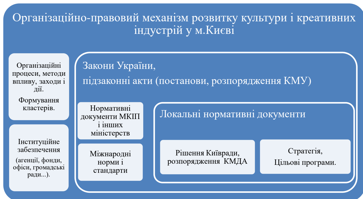
Рис.3.1. Організаційно-правовий механізм розвитку культури і креативних індустрій у м. Києві

Удосконалення організаційно-правового механізму має стосуватися системи організаційних засобів та правових норм, які забезпечують процес управління розвитком культури і креативних індустрій на національному, регіональному і місцевому рівнях (Рис. 3.1).