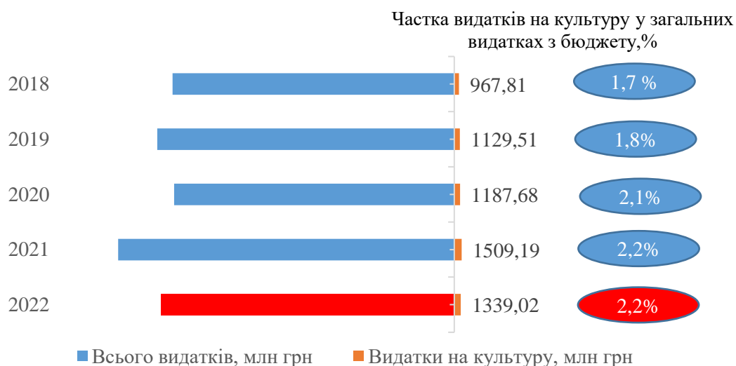
Рис. 2. 2. Видатки з бюджету міста Києва на розвиток культури і мистецтва, млн грн

Під час війни креативні індустрії зазнали відтоку талантів, скорочення фінансування, зниження попиту на культурні продукти та послуги, негативних наслідків розірваних ланцюгів постачання. Кошти, які в мирний час виділялися на культуру, в умовах воєнного стану були спрямовані на підтримку Збройних Сил України та інші критичні потреби.