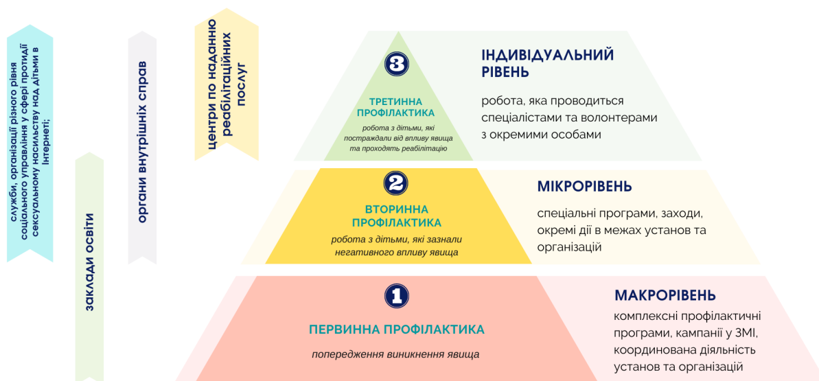
Рисунок 1. Трирівнева модель профілактики сексуального насильства над дітьми в інтернеті

працівників цих установ та організацій. В окремих випадках, коли дитина постраждала від сексуального насильства в інтернеті і потребує реабілітації, з нею спеціалісти та волонтери працюють на індивідуальному рівні.