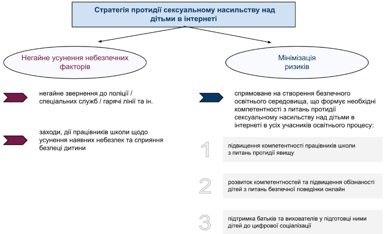
Рисунок 3. Стратегії протидії сексуальному насильству над дітьми в інтернеті на рівні школи

Взаємодія ключових суб'єктів у протидії сексуальному насильству над дітьми в інтернеті на рівні школи має відбуватися згідно керівних принципів: мультидисциплінарність; раннє втручання; професійна доброчесність; етичність та гігієна роботи з учнями (принцип «не нашкодь!»); регулярне навчання та підвищення компетентності з теми; постійність та регулярність втручань, профілактики явища; конфіденційність; безпека.