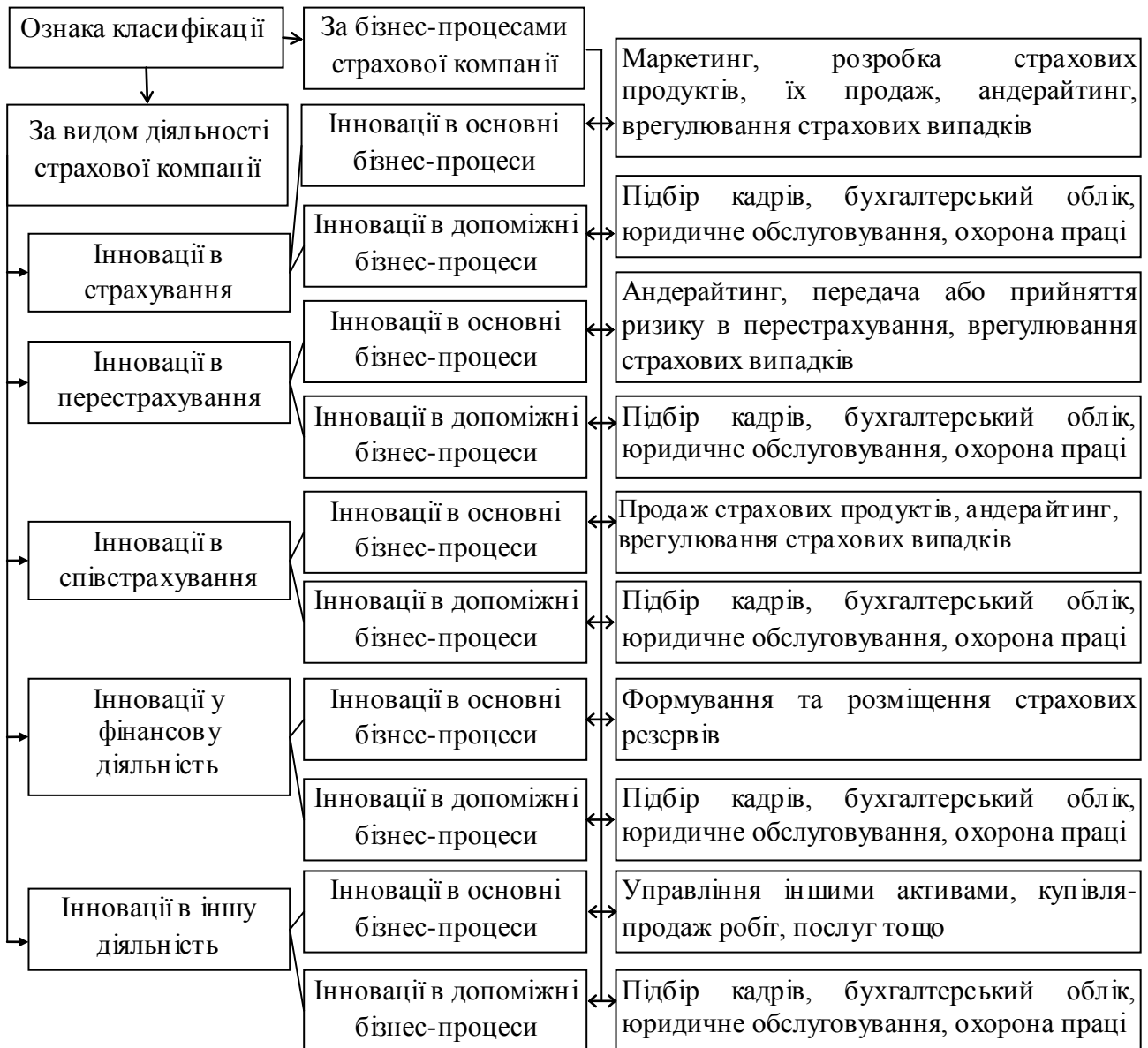
Рис. 1. Класифікація інновацій у діяльності страхових компаній

Представлене визначення діяльності страхової компанії дало змогу запропонувати класифікацію інновацій у діяльності страховиків за наступними ознаками: вид діяльності страхової компанії, а також основні та допоміжні бізнес-процеси (рис. 1).