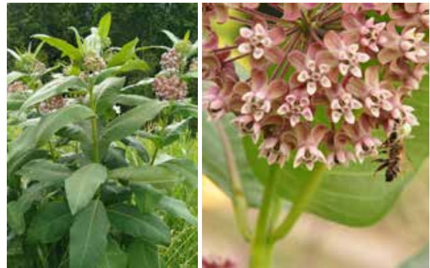
Рис. 1. Ваточник звичайний ( Asclepias syriaca ): загальний вигляд та суцвіття

шарами. Вона дуже потужна, здатна проникати на 4–5 м у ґрунт для пошуку води і поживних речовин. Одна рослина здатна рости на одному місці до 30 років. Завдяки цьому, A. syriaca добре адаптується до всіх типів ґрунтів, навіть до дуже бідних піщаних. Не боїться засух. Рослина утворює потужну розетку, яка має досить високу енергію росту, тому вже у червні–липні може значно перевищувати такі сільськогосподарські культури, як соняшник, цукровий буряк, кукурудза, пшениця, соя, ріпак. Розмножується ваточник і кореневищем, і насінням. При потраплянні насінин у ґрунт вони швидко проростають і протягом вегетаційного сезону утворюють колонію рослин, яка швидко розростається. (Вісюліна, 1957; Шиндер та ін., 2021). Здатність формувати колонії – довговічні групи рослин на місці занесення – є важливою особливістю багатьох інвазійних рослин, що сприяє їх подальшій експансії (Мосякін, 1996; Словник..., 2012).