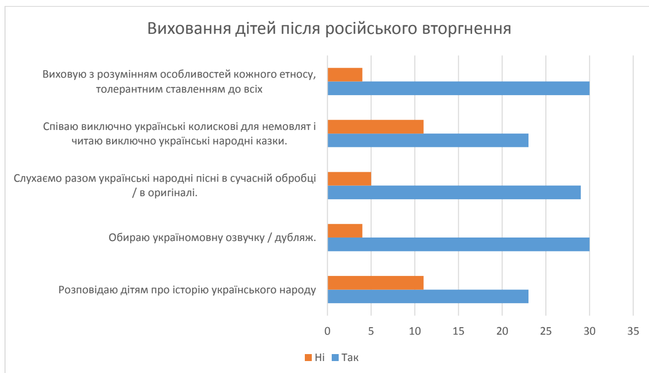
Рис 4. Розподіл відповідей респондентів на питання: G2 «Якщо ви маєте неповнолітніх дітей і ваш підхід змінився, то яким саме чином»