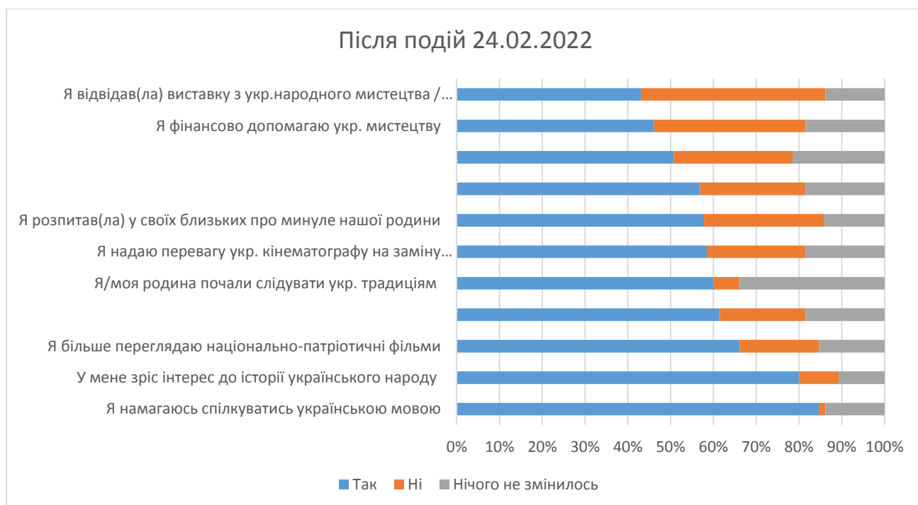
Рис. 3. Розподіл відповідей респондентів на питання: F1 «Після подій 24.02.2022...»