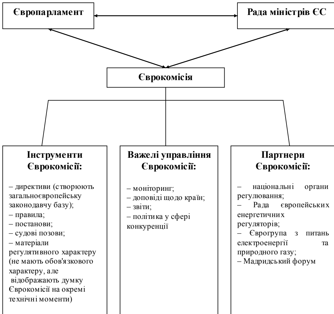
Рис. 2. Система органів і механізмів регулювання ринку природного газу Європейського Союзу

Систему органів, механізмів й інструментів регулювання ринку природного газу Європейського Союзу подано на рис. 2.