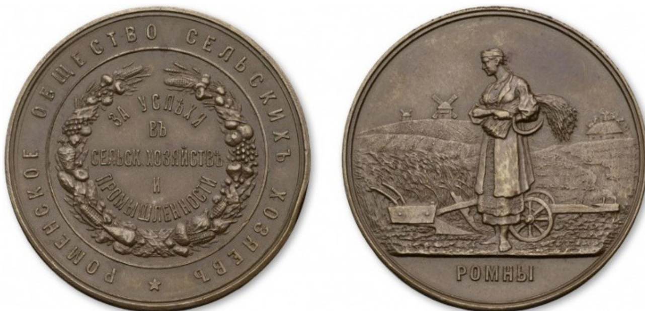
Іл. 1. Бронзова медаль Роменського товариства сільських господарів.