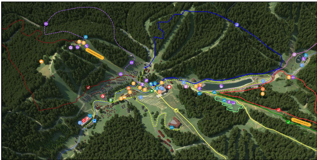
Рис. 2. Карта курорту Буковель [Т/К Буковель, 2023]

з північного заходу від долини Мізунки і на південний схід до долини Пруту. Ширина із заходу на схід становить близько 40 кілометрів. Назва походить від назви кам'яних осипів, які назвалися «Горган». Саме ці кам'яні осипи є ключовою особливістю даного масиву. Найвища вершина масиву Горган – гора Сивуля висотою 1836 метрів. Район дуже популярний у туристів, тут проходять найбільш дикі маршрути в Карпатах. В Горганах знаходиться перлина Карпат – озеро Синевир, Манявський водоспад, гірськолижний курорт Буковель та ще багато цікавих пам'яток (Байцар, 2014)