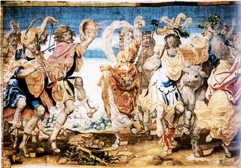
Рис. 4. Один із дев'яти gobеленів із серії «Історія Тесея», Королівський палац, Мадрид, близько 1630 р., автор картону фламандський художник Антуан Салаерт, майстерня Жана Райєса Молодшого.

Найважливішим завданням у вивченні gobелена «Зустріч Давида» залишається його датування та більш точна атрибуція. Процес уточнення датування, визначення автора картону та місця створення gobелена «Зустріч Давида» із колекції Національного музею мистецтв імені Богдана та Варвари Ханенків дав можливість простежити один із