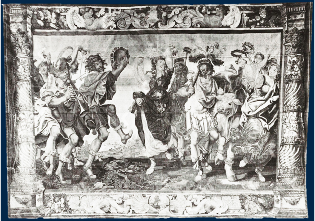
Рис. 7. Гобелен «Тесеї перемагає бика Марафона» (з бордюром) із серії «Історія Тесея»

хоча Давид тримає її інакше, ніж Тесеї (Рис. 4), який лівою рукою веде бика за рог. Проте місце між групою центральних фігур і групою жінок праворуч на гобелені з музею Ханенків заповнено дещо менш професійно. Фігура жінки на другому плані обрізана, у неї немає ніг, натомість по горизонталі просто було продовжено пейзаж. Там, де мало би починатись небо, домальовані вертикальні складки сукні без надання їм будь-якого об'єму (Рис. 3). Ці складки стилістично невиправдані, бо увесь гобелен наповнений щед्रो закрученими бароковими формами. Через те, що фігура жінки розташована там, де починається небо, здається, ніби вона перебуває за лінією горизонту. Лише тому, що цю жіночу постать певною мірою перекидає інша жіноча фігура першого