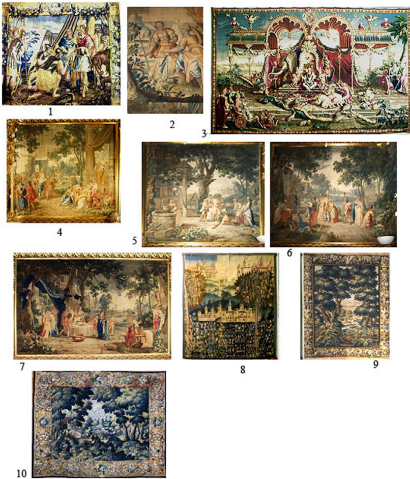
Рис. 1. Гобелени з колекції Національного музею мистецтв імені Богдана та Варвари Ханенків:

1-7 – багатофігурні композиції (гобелени першої групи); 8-10 – пейзажні гобелени (вердюри)- гобелени другої групи