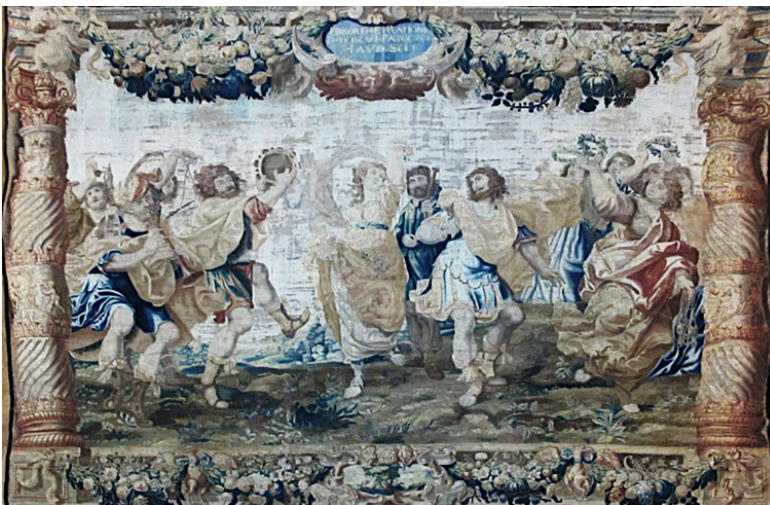
Рис. 3. Зустріч Давида? Автор картону А. Салаерт, Брюссель, Фландрія, перша половина XVII ст. Закуплено Ханенками на одному з аукціонів у Західній Європі у кінці XIX ст.

На час знайомства з колекцією гобеленів з музею Ханенків мусимо констатувати його незадовільний стан: упродовж десятків років він висів на стіні й