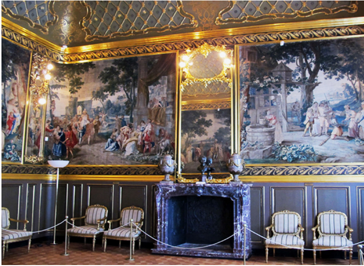
Рис. 2. Гобелени в експозиції Музею мистецтв імені Богдана і Варвари Ханенків

темно-брунату, майже чорну стрічку-галон. Цей галон за тоном випадає з усієї кольорової гами, адже на гобелені переважають світлі тони вохристо-бежевого кольору з композиційно врівноваженими насиченими синіми плямами. Частина гобелена без механічного врізання по