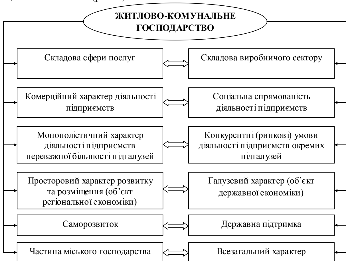
Рис. 1. Теоретичні аспекти змісту житлово-комунального господарства з позицій представників різних наукових шкіл

Житлово-комунальне господарство як об'єкт дослідження суспільної географії являє собою складне, цілісне, багатогалузеве угруповання житлового фонду з одного боку, та підприємств, установ, організацій та відповідної інфраструктури комунальної сфери регіону, з іншого, основним завданням якого є максимальне задоволення житлово-комунальних потреб кінцевого споживача (рис. 1).