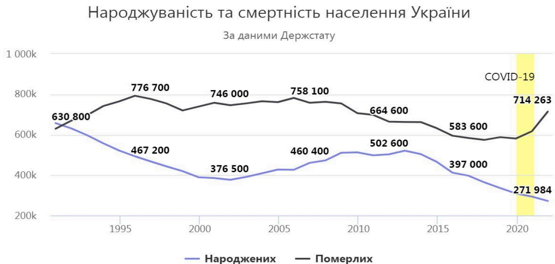
Рис. 2.2.2. Кількість народжених та померлих. Дані із сайту Державної служби статистики України (у тисячах).

На рисунку ми можемо спостерігати, що кількість померлих переважає кількість народжених за рік. Тому ми можемо дійти до невтішних висновків, що з кожним роком населення нашої держави буде невпинно скорочуватися, оскільки смертність переважає над народжуваністю.