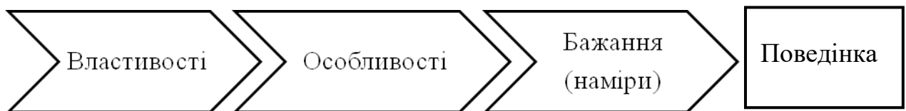
Рис. 3.1.1. Концепція «Traits-Desires-Intentions-Behaviour» (TDIB)

4. Хибно негативні наміри – якщо народження дитини відбувається «не заплановано», за висловленого раніше небажання мати дітей, через незаплановані вагітності та/або появу нового партнера.