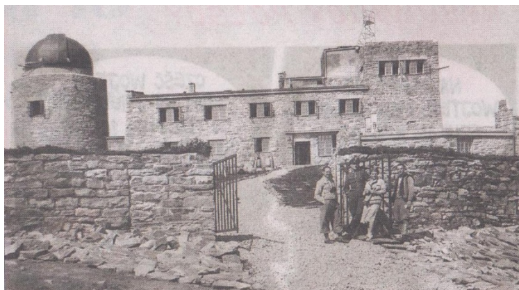
Рис. 1. Метеорологічно-астрономічна обсерваторія "Білий слон" на вершині г. Піп Іван (фото 1938 р.) [14, 4]