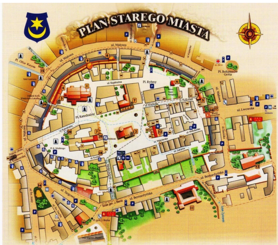
Рис. 3. План старої частини м. Тарнова [15]

(рис. 3). Коли у 1797 р. євреям було дозволено жити в Кам'янці-Подільському, заможніші карвасарські євреї переселилися до міста, а на Карвасарах залишилась єврейська біднота. У XIX – на початку XX ст. єврейська громада міста проживала компактно у східній частині Кам'янця (на Східному бульварі, або т. зв. Валах). Тут діяли дві синагоги та єврейська школа, а біля річки була в ті часи єврейська громадська лазня, яка до наших часів не збереглася. На Валах жили євреї-торговці, ремісники, а також візники, які мали коні й балагули – криті дорожні вози, тому й самих візників називали балагулами. Кам'янецькі балагули перевозили пасажирів до Жванця, Старої Ушиці, Дунаївців, Проскурова, Меджибожа, Старокостянтинова, Сатанова та інших подільських міст і містечок.