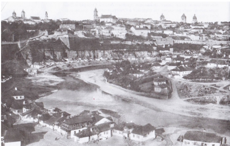
Рис. 4. Кам'янець-Подільський: панорама Карварсар [1, с. 167]