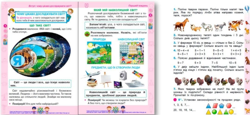
Рис. 5. Приклади перевантаження сторінок підручника візуальними елементами