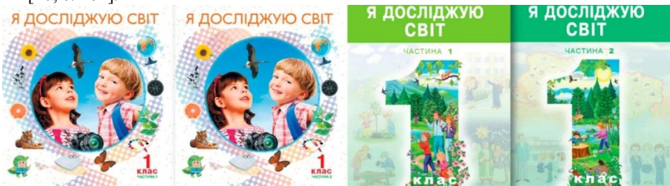
Рис. 4. Приклади ідентичного оформлення різних частин підручників

2. Дві частини підручника мають ідентичне оформлення. Якщо підручник випущено у двох частинах варто виконувати кожну частину в єдиному стилі, але з різними зображувальними чи декоративними елементами. Порівняймо оформлення обкладинок на рис. 4. У прикладі справа перша і друга частини підручників об'єднані спільною композицією, проте мають різну кольорову гаму та різні зображення, що сприяє успішному орієнтуванню учнів у навчальному матеріалі, мотивує переходити до наступної частини в процесі навчання[10, с. 161].