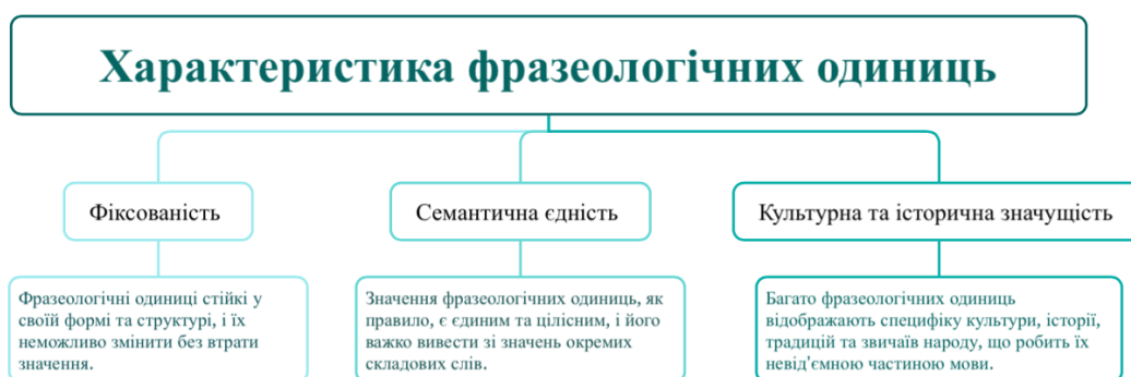
Рис.1.1 Характеристика фразеологічних одиниць