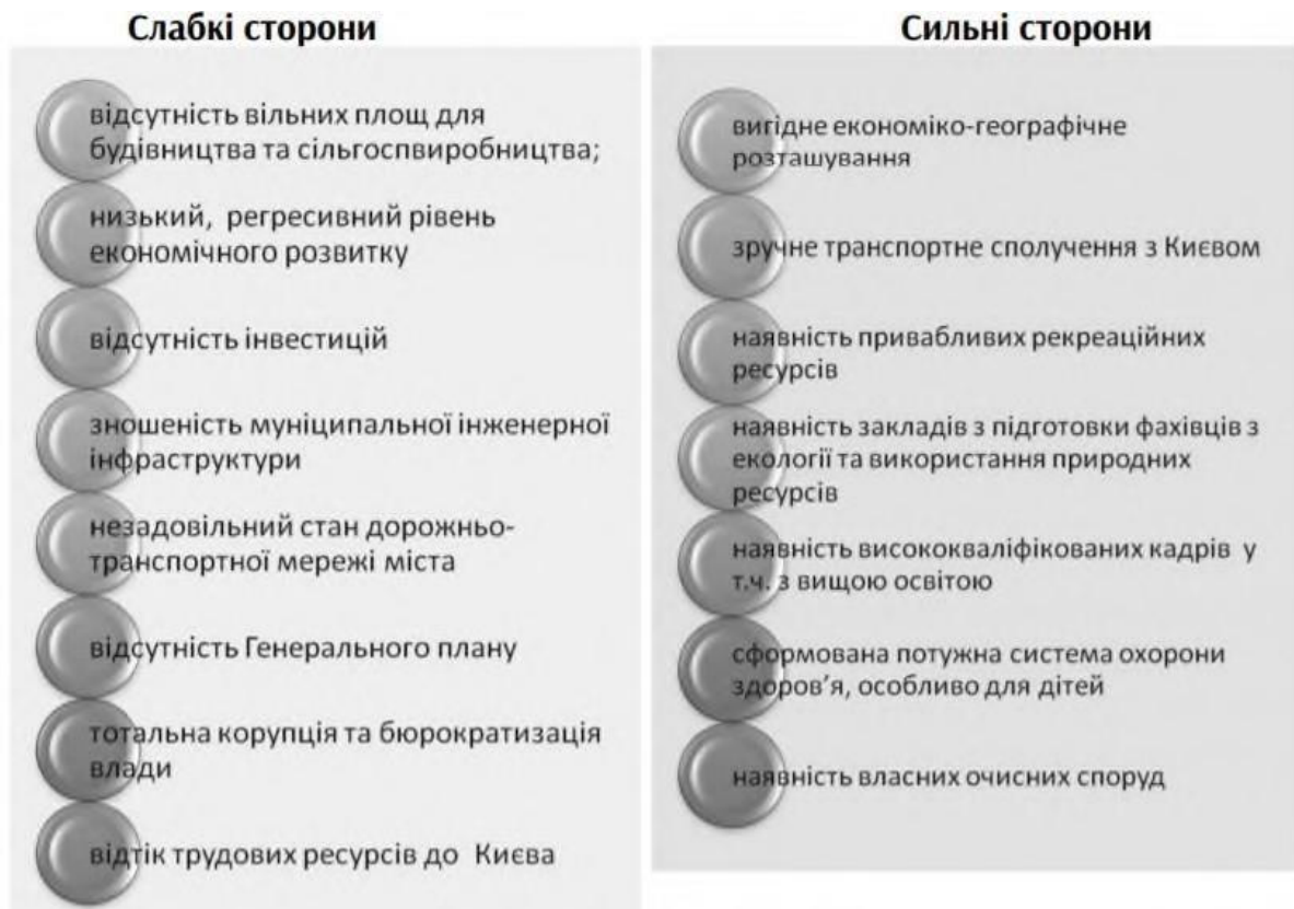
Рис. 3.1. Сильні та слабкі сторони стратегічного планування розвитку Гостомельської ТГ

За результатами проведеного дослідження стану проблем стратегічного планування розвитку територіальної громади вважаємо доцільним запропонувати Гостомельській селищній раді Київської області такі рекомендації та пропозиції: